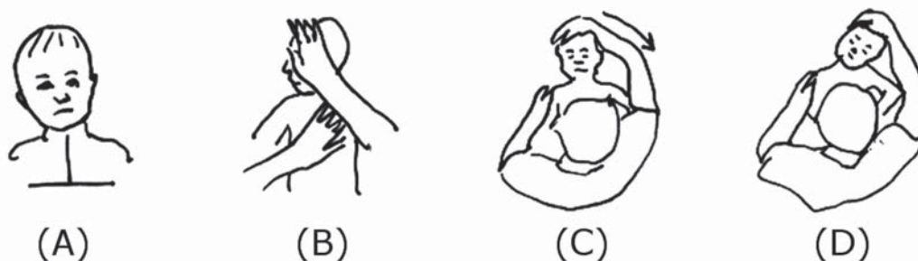
Slika 6. Tortikolis s glavom nagnutom u desnu stranu (A). Vježbe uključuju nježnu rotaciju glave udesno (B) i nježno istezanje glave i vrata ulijevo (C i D).

Fig 5 Torticollis with a head tipped towards his left side (A). Exercises involve gently rotating his head to the left (B) and gently stretching his head and neck towards the right (C, D).