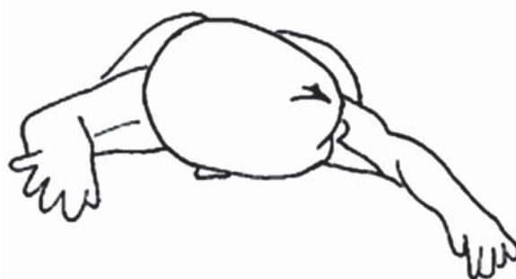
Slika 2. Lijevostrani tortikolis: dijete je na trbuhu, igračke treba postaviti s njegove lijeve strane kako bi se licem okrenulo ulijevo (lijevostrani tortikolis).

Igra u pronacijskom položaju mora biti u korektivnom položaju (slike 2. i 3.).