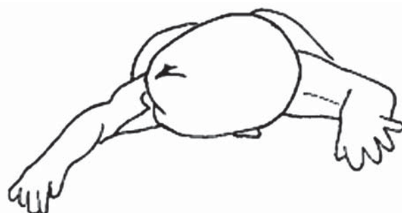
Slika 3. Desnostrani tortikolis: dijete je na trbuhu, igračke treba postaviti s njegove desne strane kako bi se licem okrenulo udesno.

Fig 2 Torticollis with a head tipped towards his left side: position on stomach, toys should be placed on his lefthand side, so the child has to turn his head toward left.