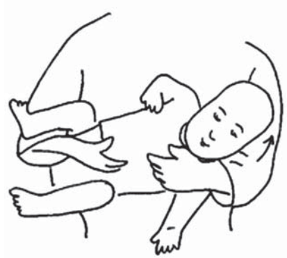
Slika 4. Nošenje djeteta kod lijevostranog tortikolisa. Fig 4 Carrying a baby with his head tipped towards his left side.

Nošenje djeteta kod desnostranog tortikolisa