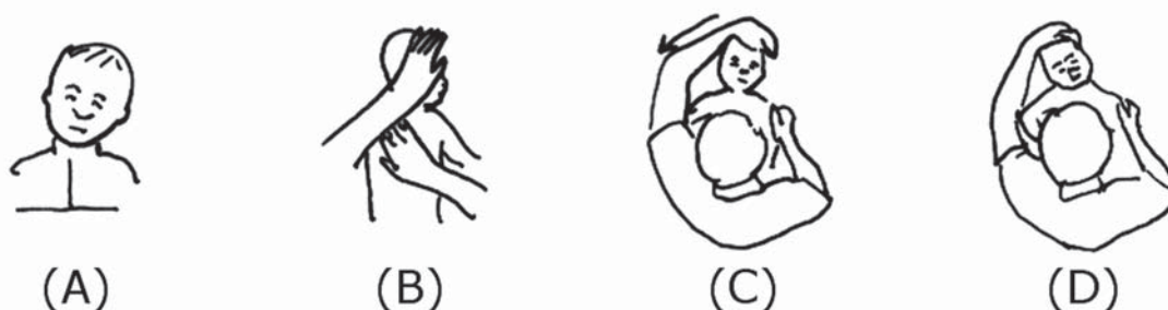
Slika 5. Tortikolis s glavom nagnutom u lijevu stranu (A). Vježbe uključuju nježnu rotaciju glave ulijevo (B) i nježno istezanje glave i vrata udesno (C i D).

potiče na izvođenje aktivnog pokreta u željenom smjeru i tako dobije potpuni aktivni i pasivni opseg pokreta vrata u svim smjerovima i normalna snaga vratnih mišića (5).