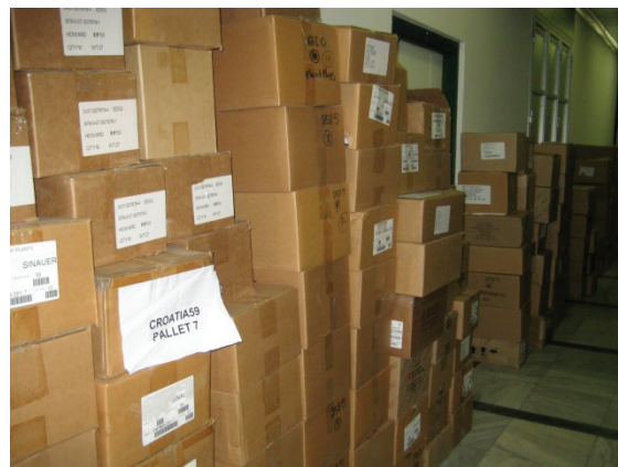
Slika 1 – Jedan dio knjiga Fondacije Sabre u kutijama na Fizičkom odsjeku PMF-a

Ovom 59., posljednjom donacijom knjiga 2013. pristigle su 8102 knjige. Dobivene knjige su eminentnih svjetskih izdavača, velik broj su izdanja novijih datuma i raznovrsnih znanstvenih područja.