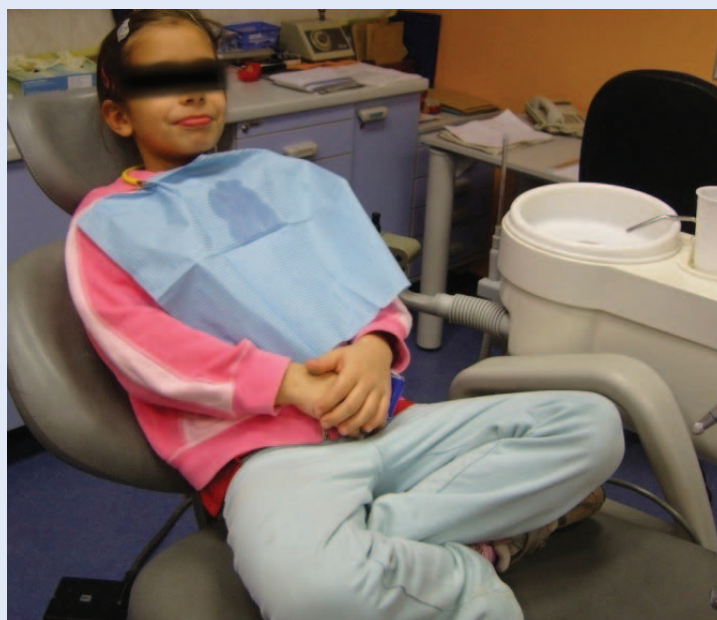
Slika 1. Kooperativno dijete koje je još uvijek na oprezu

Potencijalno nekooperativna djeca imaju izražen dentalni strah koji ih sprječava da surađuju s liječnikom tijekom zahvata. U skupini potencijalno nekooperativne djece razlikujemo nekoliko oblika ponašanja: nekontrolirano („histerično”), prkosno (tvrdooglavo), bojažljivo, napeto kooperativno, plačljivo i stoičko ponašanje 7 .