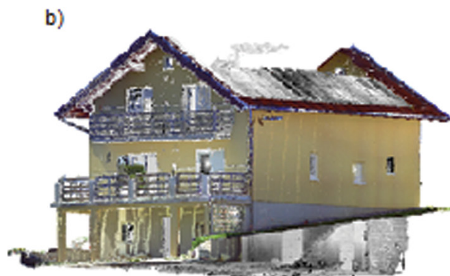
Slika 4.4. a) Prikaz oblaka točaka predmetnog objekta i okućnice b) Prikaz reduciranog oblaka točaka objekta