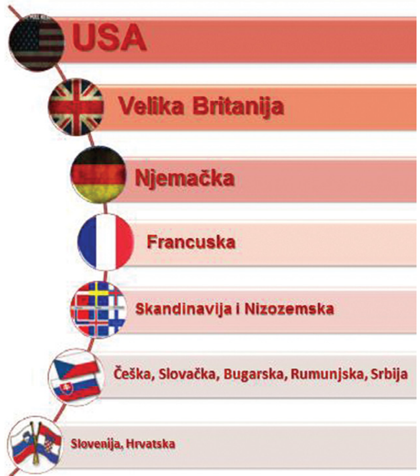
Slika 2.2. Implementacija BIM rješenja na svjetskoj razini

U Ujedinjenom Kraljevstvu svijest o prednostima BIM-a dovela je čak i do izrade strategije za njenu provedbu, BIS ( Department of Business Innovation and Skills ) BIM Strategy , što je zapravo najambiciozniji i najnapredniji program na svijetu. Samim time, po njihovim riječima, UK ima ključ za uspjeh u nacionalnim sferama, ali i mogućnost da preuzme vodeću globalnu ulogu u korištenju BIM tehnologije (URL-1).