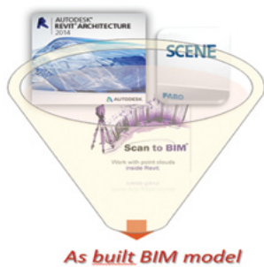
Slika 4.2. Prikaz korištenih alata

U ovom radu prikazan je cijeli proces stvaranja BIM modela građevine, tj. modela obiteljske kuće (Slika 4.3.) oblikovanog iz podataka laserskog skeniranja. Prikazana je faza prikupljanja podataka, faza njihove registracije te faza modeliranja.