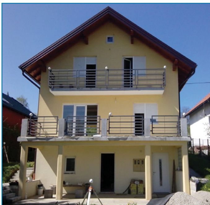
Slika 4.3. Prikaz ulaznog pročelja predmetnog objekta

Oduvijek su graditelji izrađivali skice i nacрте koji vizualno predočavaju objekte koje će sagraditi. S vremenom ti nacrti postaju sve složeniji i detaljniji. Razvojem tehnologije dvodimenzionalni nacrti prelaze u trodimenzionalne modele. Više se ne crtaju linije koje primjerice prikazuju zid već se modelira virtualni zid koji u dokumentaciji može biti prikazan grafički (tlocrt, presjek, pogled ili 3D) i parametarski koji sadrži ostale bitne informacije (namjena (nosivi, nenosivi, pregradni), materijali, slojevi, fizikalna svojstva, faza (postojeće, za rušenje) i slično). Korištenjem alata za trodimenzionalno projektiranje stavlja se naglasak na samo projektiranje te se olakšava izrada projektne dokumentacije isključujući moguće pogreške u ranoj fazi izrade projekata ( URL-5 ). Sami postupak modeliranja odvija se u nekoliko faza. U prvim fazama modeliraju se temeljni građevinski elementi: zidovi, podovi, stropovi i krovnište. U nastavku slijedi modeliranje vrata i prozora, ograda i ostalih detalja. Kao završni korak modelira se okolni teren. Na ovom primjeru, usporedbom oblaka točaka dobivenog laserskim skeniranjem i BIM modela, moguće je zaključiti da dobiveni 3D model zorno prikazuje izvedeno stanje objekta (Slika 4.5.).