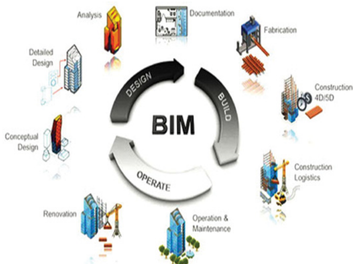
Slika 2.1.1. Prikaz životnog ciklusa građevine (URL-3)

troškovima njihove zamjene, što svakako pomaže vlasnicima da shvate prednosti ulaganja u materijale i sustave koji možda zahtijevaju veća početna ulaganja, ali osiguravaju veći povrat tijekom životnog vijeka objekta. Vlasnici mogu isto tako iskoristiti prednosti BIM modela stvorenog nakon izgradnje za vizualizaciju prostora, pregled promjena u rasporedu ili predlaganje redizajniranja. BIM također otvara vrata brojnim analizama kao što je učinkovito korištenje energije, upravljanje imovinom i olakšano održavanje (Kazi i dr., 2009). Povezivanje različitih procesa kroz životni vijek građevine moguće je vidjeti na slici 2.1.1.