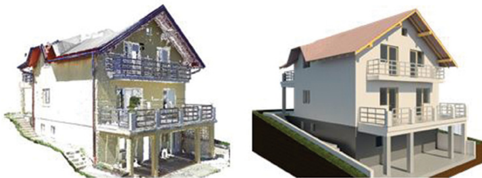
Slika 4.5. 3D oblak točkica (lijevo) i 3D BIM model (desno)