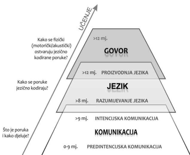
Slika 1. Razvojna piramida razvoja komunikacije, jezika i govora

Komunikacija je temelj i potporni stup usvajanja jezika i razvoja govora: a) jezik se uči u komunikaciji, b) govor je jedno od sredstava koja koristimo u komunikaciji, c) razvojna ekspanzija jezično-govornih sposobnosti nastaje nakon što dijete nauči kako porukom utjecati na pažnju druge osobe, tj. nakon što su usvojene osnove komunikacije. Važno je uočiti da prije nego što počne govoriti (prve riječi sa značenjem uglavnom se javljaju u dobi od 12 mjeseci, a rječnički brzac u dobi od 18 mjeseci), dijete mora usvojiti niz znanja i vještina, koje će mu omogućiti da postane komunikacijski aktivno i “pripremi se” za usvajanje jezika.