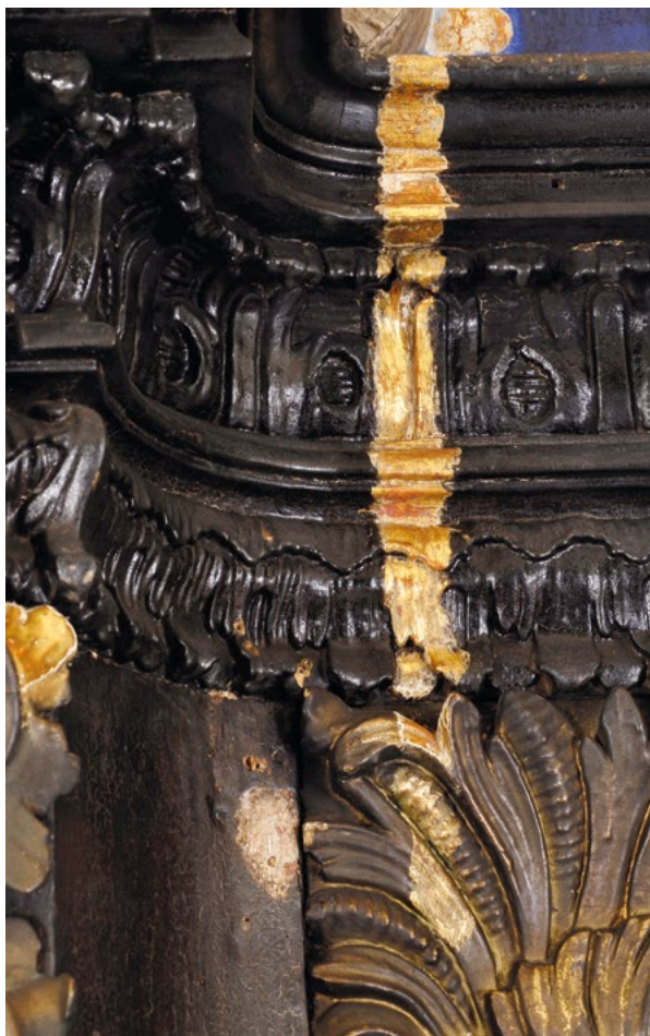
10. Detalj stanja oltara s probom uklanjanja preslika The detail of the altarpiece in the course of the removal of the overpaint

mogućoj površini s minimalnom količinom destilirane vode, dovoljnom da se izmjeri koncentracija vodikovih iona. Mjernu površinu nakon mjerenja treba osušiti.