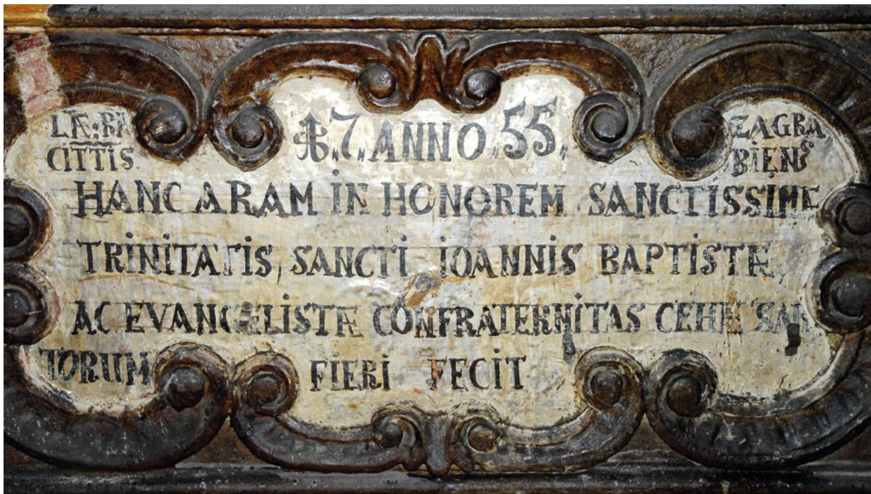
3. Natpis na predeli oltara nakon uklanjanja preslika An inscription on the altar predella, after removing the overpaint

AE CI[VII]T[A]TIS ANNO 1755. ZAGRABIENS[IS]/ HANC ARAM IN HONOREM SANCTISSIMAE/ TRINITATIS SANCTI IOANNIS BAPTISTAE/ AC EVANGELISTAE CONFRATERNITAS CEHE SAR/ TORUM FIERI FECIT (Slobodnoga i kraljevskoga grada Zagreba godine 1755. ovaj oltar u čast Presvetog Trojstva, sv. Ivana Krstitelja i Evanđelista dao je izraditi ceh krojača) za koji Kukuljević Sakcinski navodi da se „nalazio na oltaru nekoč Presv. Trojstva i Ivana Krst. u župnoj crkvi sv. Marka“ 9 (sl. 3)