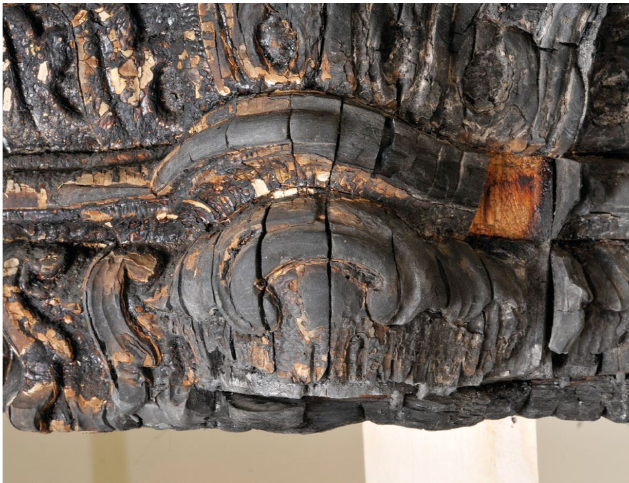
8. Detalj nagorjelog vijenca oltara, prije radova

A detail of the burnt altar cornice, before conservation