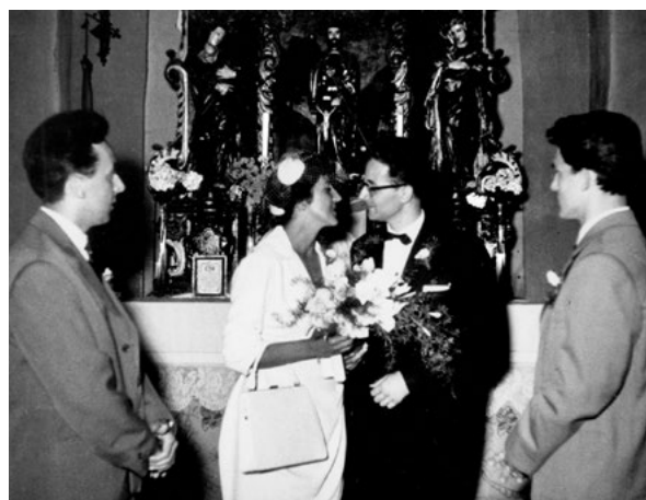
5. Vjenčanje Durbešić, u drugom planu oltar sv. Roka sa skulpturama sv. Ivana Evanđeliste i Bogorodice The Durbešić wedding, in the background is St. Rocco's altar with the sculptures of St. John the Evangelist and the Virgin

Od kraja 18. stoljeća povijest crkve Sv. Marka ispunjena je nizom zahtjeva i argumenata za i protiv rušenja crkve