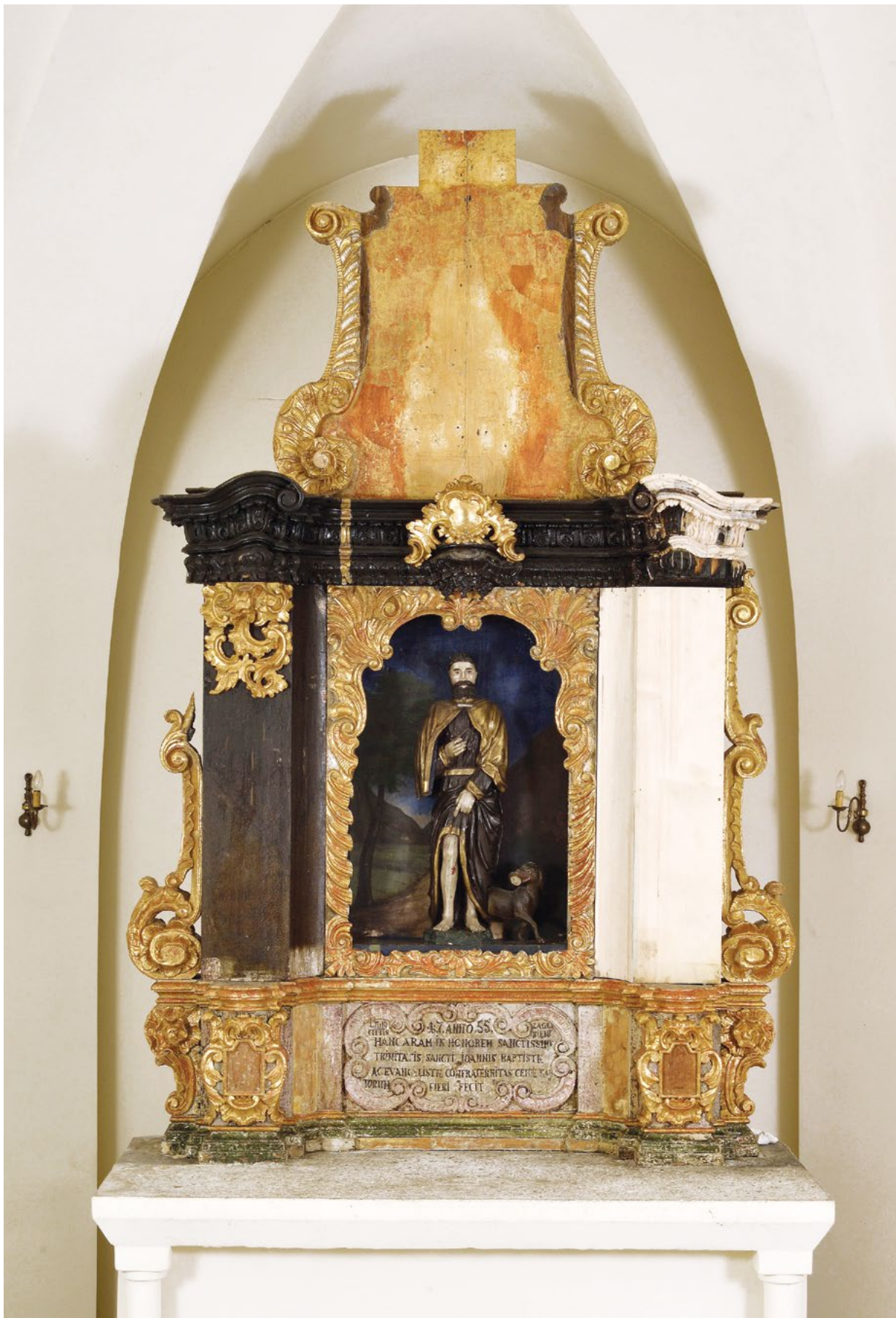
11. Stanje oltara nakon djelomičnog uklanjanja preslika

Condition of the altar in the course of partially removing the overpaint