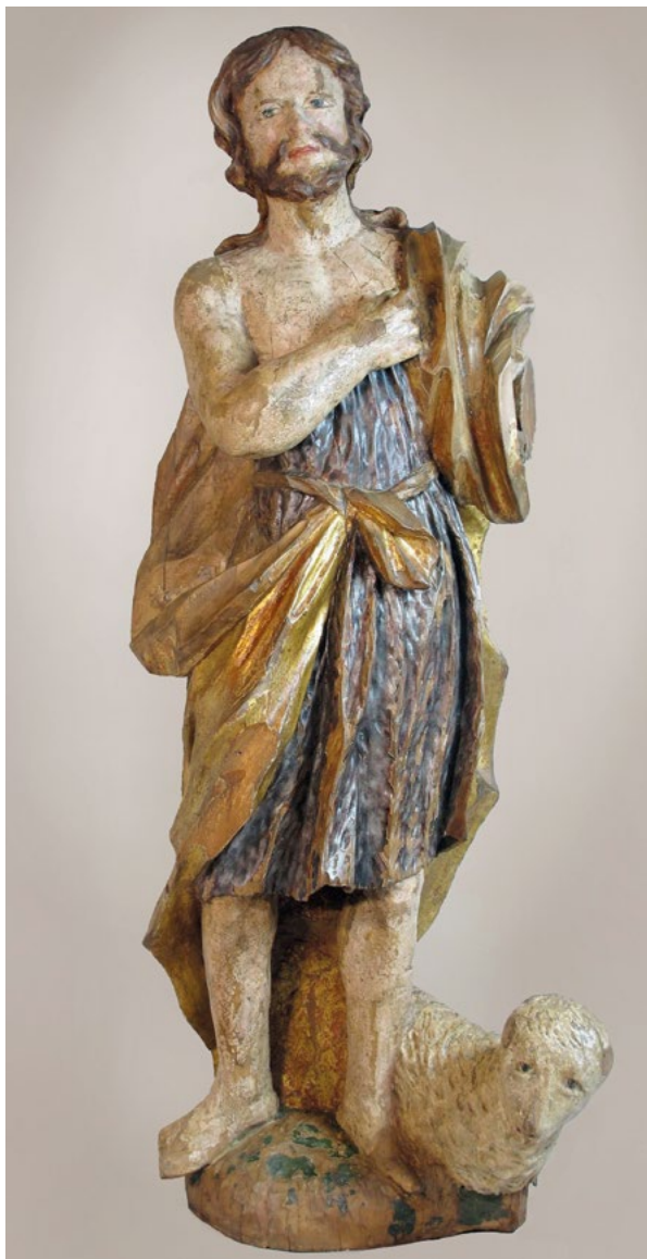
6. Skulptura sv. Ivana Krstitelja iz zbirke Muzeja grada Zagreba (fototeka MGZ-a) The sculpture of St. John the Baptist from the Zagreb City Museum collection (The Zagreb City Museum Photo Archive)

koloritno razmahanim, prekićenim baroknim oltarima i inventaru koji je više odvlačio pozornost vjernika nego ih usmjeravao k duhovnosti. 21 Kako navodi Dragan Damjanović, upravo su barokni oltari biskupu Strossmayeru bili jedan od glavnih poticaja da pokrene obnovu crkve Sv. Marka. 22 Prema svemu sudeći, oltar Presvetog Trojstva, sv. Ivana Evanđelista i sv. Ivana Krstitelja uklonjen je tijekom radikalne Schmidt-Bolléove obnove (1876.-1882.) zajedno s drugim baroknim inventarom i oltarima koji su većinom uništeni ili razneseni. Najveći dio skulptura s oltara, šezdesetak njih, bio je do 1911. godine deponiran na tavanu ženske kaznionice u Savskoj ulici, a onda je prenesen u Muzej grada Zagreba, dok je dio završio u drugim crkvama 23 ili u privatnom posjedu. 24 Razumljivo je da se, kako kaže Držićev Pomet, trijeba s brjemenom