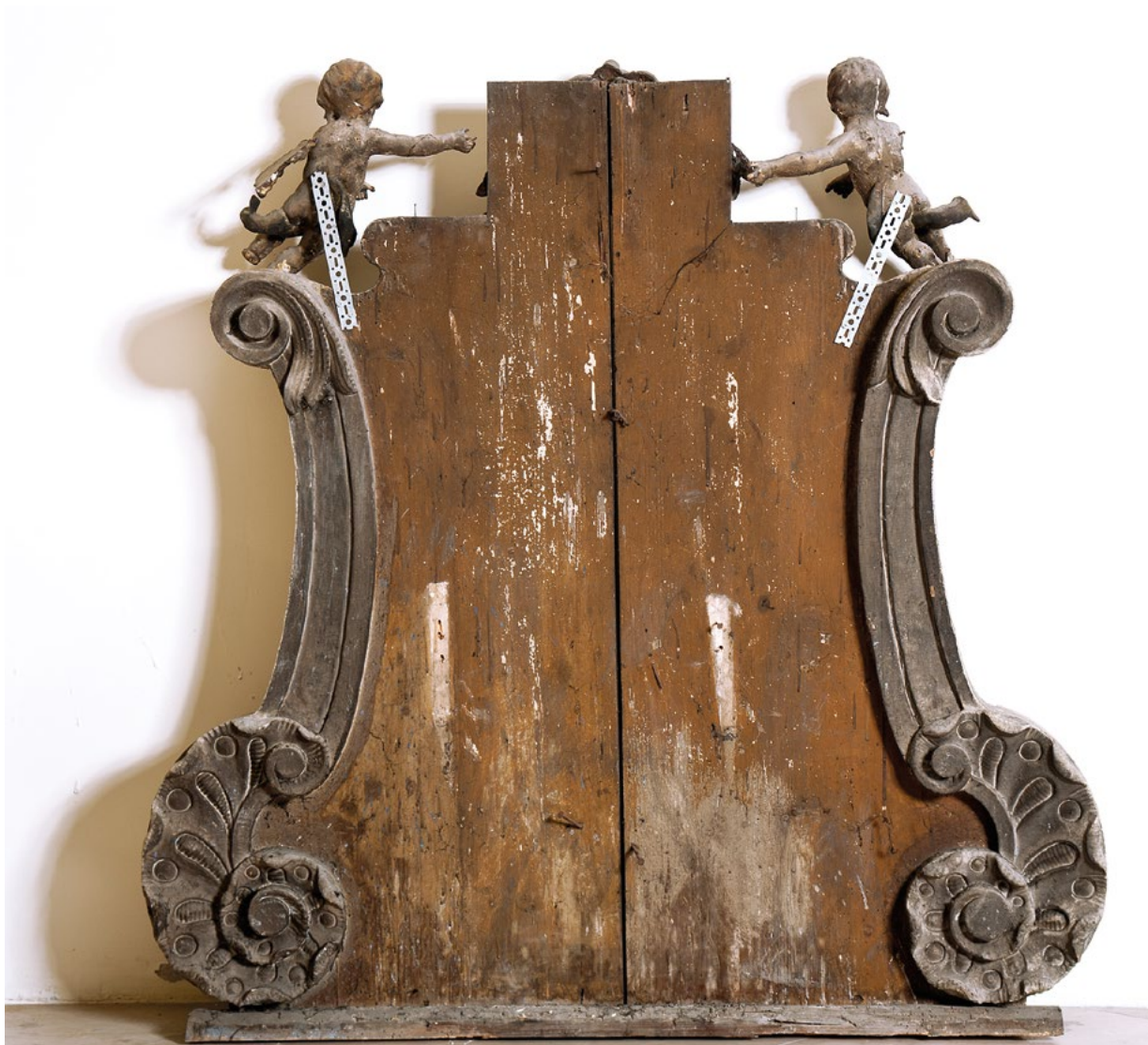
2. Pozadina atike oltara sv. Roka, prije radova Back side of the St. Rocco's altar attica, before conservation

kipovi sv. Elizabete, sv. Ambrozija i sv. Sebastijana koji su se nalazili na oltarima. Bočni oltari i navedene skulpture više se ne spominju nakon potresa 1880. godine. 8