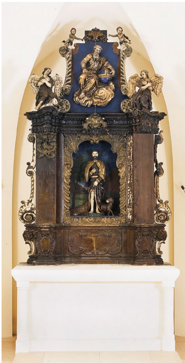
1. Oltar sv. Roka, stanje prije radova Zagreb, St. Rocco's Church, the altar of St. Rocco, condition before conservation

vrha atike visio je na jednom čavlu, a bilo je vidljivo da su obje bočne volute atike uzdužno izrezane. S krila desnog anđela uljni preslik je bio neujednačeno uklonjen. Oslík je najvjerojatnije mjehurasto nabubrio od topline vatre, a nakon što se ohladio i ponovo stvrdnuo, lako ga je bilo mehanički ukloniti/sastrugati, slično postupku skidanja starih uljnih premaza s drvenarije (prozori, vrata). Na retablu s prednje i stražnje desne strane nedostajali su rocaille ukrasi, koji postoje na lijevoj strani. Oltar je zatečen preslikan tamnosmeđom, crnom i tamnoplavom bojom.