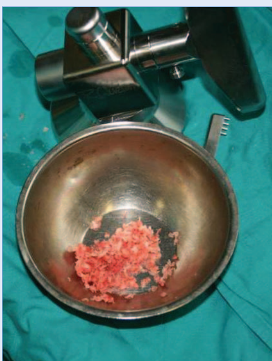
Slika 5. Mlinac za kost i samljevena kost s kriste ilijake