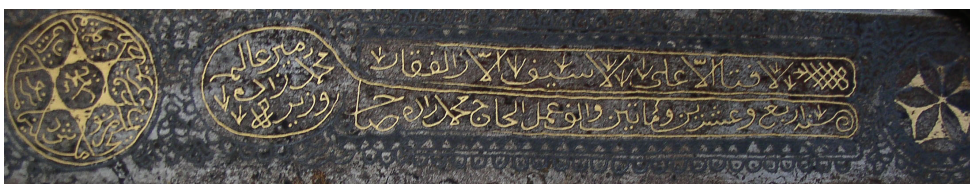
Sl. 5. Kartuša s natpisom na arapskom i osmanskom jeziku (desno) i okrugli ornament s natpisom na arapskome (lijevo)