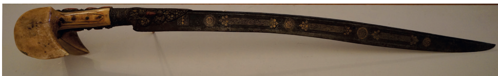
Sl. 1. Bogato dekoriran jatagan bjelosapac izrađen početkom 19. stoljeća