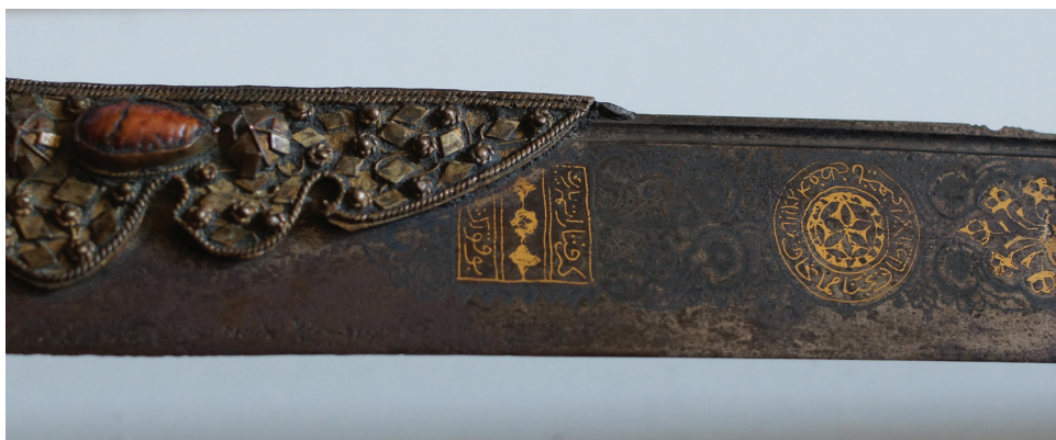
Sl. 3. Četvrtasti ornament djelomice prekriven parazvanom (lijevo) i okrugli ornament (desno)