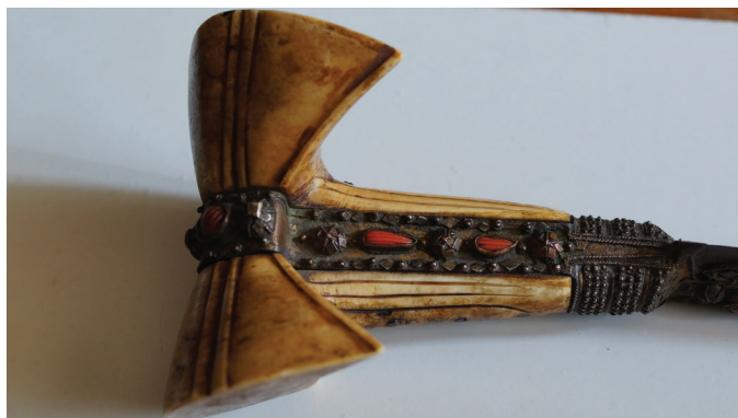
Sl. 2. Obloge drška sa sedam našljebljenih koraljnih zrna