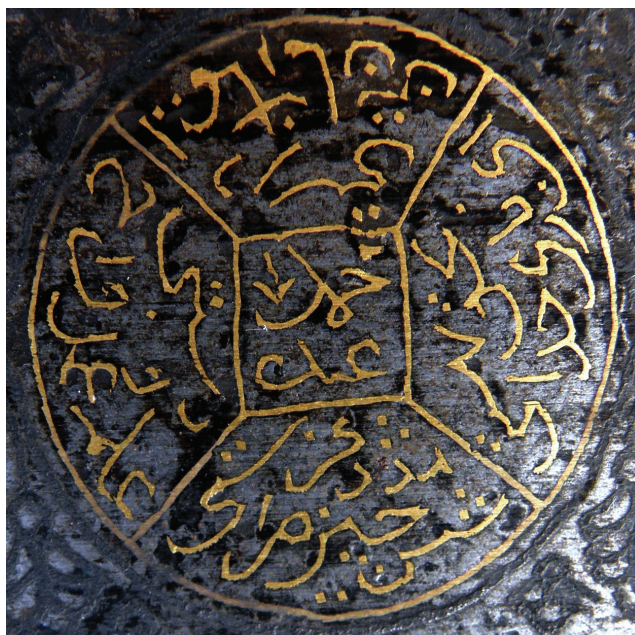
Sl. 6. Okrugli ornament