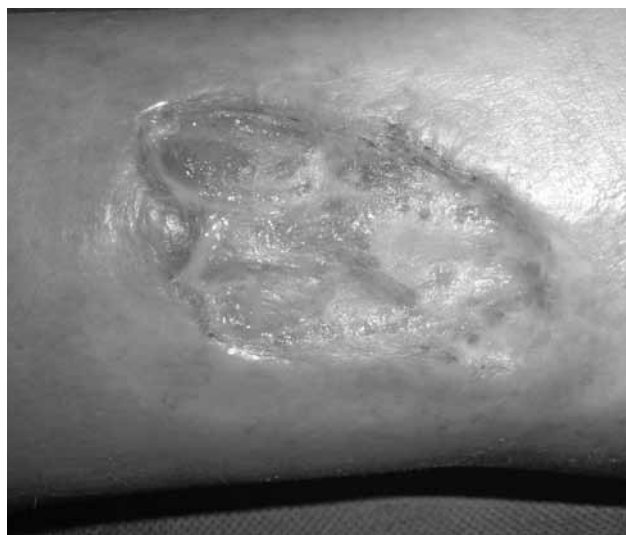
Sl. 1. Ulkus na potkoljenici u bolesnika sa sindromom CREST

U CREST sindromu prisutna je distrofična kalcifikacija. U etiologiji ulkusa važni su i ponavljajuće traume, infekcija, venska hipertenzije i ishemija (21).