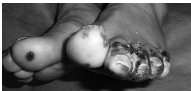
Sl.4. Congelatio (smrztotine)

Congelatio (smrztotine) se dijele u tri stupnja. Smrztotine trećeg stupnja ( congelatio esharotica ) – zahvaćeno područje postaje lividnoplavo, tvrdo i neosjetljivo, zatim nastaje suha ili vlažna nekroza (25).