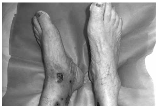
Sl.3. Bolne ulceracije na potkoljenicama i smeđa diskoloracija nokatnih ploča u bolesnika na terapiji hidroksilurejom

U bolesnika na dugotrajnoj terapiji (u prosjeku 5 godina) i visokim dozama lijeka mogu se pojaviti brojne bolne ulceracije, obično eritematozne s fibrinskim naslagama i nekrozom, okružene s atrophie blanche . Najčešće su locirane na koži oko medijalnog maleola, na dorzumu stopala i potkoljenici. Prisutne su smečkaste diskoloracije nokatnih ploča (23,24).