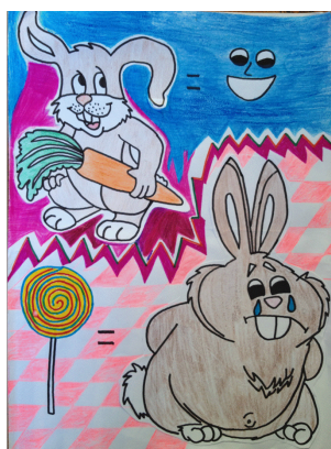
Figura 1. Creación publicitaria grupo 1

Como ejemplo podemos observar un afiche diseñado por el Equipo 1 (Figura 1), grupo que decidió que la publicidad estaría dirigida a todos los niños que les tocó analizar ya que presentan características similares. En ella, debido a que la matemática que manejan es casi nula, se intentó establecer “relaciones” entre el consumo de frutas y verduras (representada por una zanahoria) y la felicidad del conejo, y la relación entre el consumo excesivo de dulces y la tristeza del conejo.