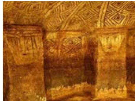
Figura 2. Algunas configuraciones con romboides que se encuentran en el Parque.

El rombo, o mejor romboide para este caso, es la figura geométrica de mayor empleo en los diseños. Él, no siempre fue creado como unidad sino que apareció como consecuencia de alguna construcción geométrica, es decir, aparecían por la interceptación de la familia de líneas paralelas oblicuas hacia la izquierda al interceptarse con la familia de líneas paralelas oblicuas hacia la derecha, aunque dependiendo la estructura del hipogeo esto puede cambiar. Estos romboides manejan distintos grados de nivel de concentricidad y combinación tanto cromática como de poligonales y superficies, como se puede ver, a manera de muestra, en la siguiente Figura.