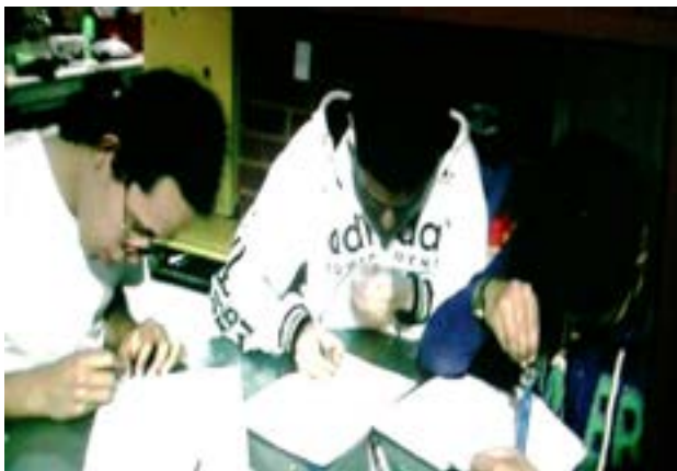
Realizando la construcción gráfica de la situación

En las conversaciones de los resolutores se menciona explícitamente la importancia que tiene el planteamiento de preguntas, Brousseau (1986) compara este hecho con el de solucionar el problema y les da el mismo estatus de importancia. Se evidencia cómo los estudiantes a partir de preguntas y exploraciones logran abordar el problema desde las representaciones gráficas con miras a esclarecer los conceptos inmersos en la situación y plantearse su problema de demostración.