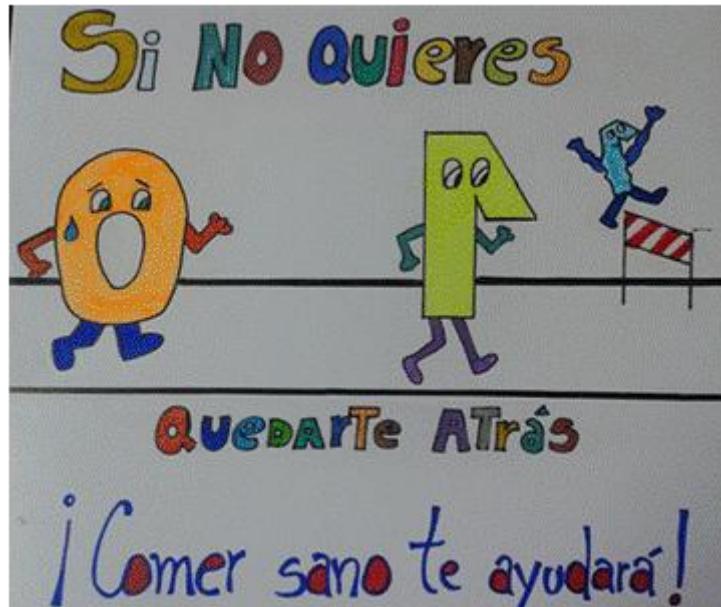
Figura 3. Creación publicitaria grupo 2

El grupo 4 realiza un afiche publicitario con el slogan “No comas más pizza” usando letras, dibujos, signos y símbolos para formarlo (figura 4).