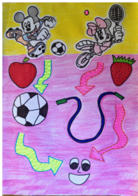
Figura 2. Creación publicitaria grupo 1

La figura 2 es un afiche publicitario que va dirigido a los tres cursos que analizaron (pre-kinder, kinder y 1° de primaria), que no presentan diferencias significativas en sus resultados; este afiche muestra la relación entre el consumo de frutas, el deporte y la felicidad; se usan dibujos animados conocidos por los estudiantes (Mickey y Minnie). Los autores de este afiche decidieron trabajar con estas relaciones, pues el conocimiento matemático de los estudiantes es casi nulo.