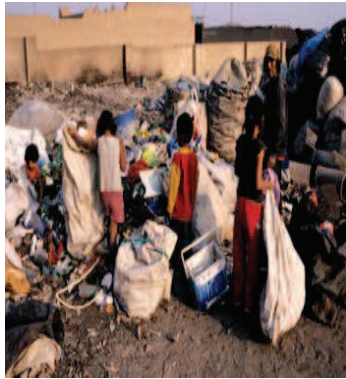
La República . Febrero 16, 2010