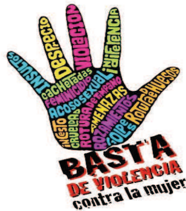
Fonoaudiología Unipamplona. Septiembre 9, 2010

Es un tema que mantiene penosa actualidad en el Perú y otros países.