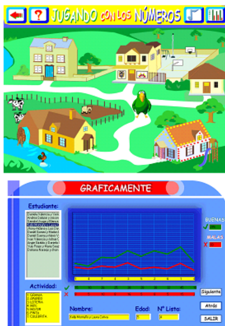
Figura 1. (a) Interface principal del juego “Jugando con números” (b) Interface de desempeño del Estudiante.

Inicialmente veremos el software “Preescolar: Jugando con los Números”, el cual tiene por objeto ser una herramienta que ayude al docente en la formación de la noción de número en los estudiantes de grado preescolar, además será útil para inducir a los estudiantes en el área de la informática.