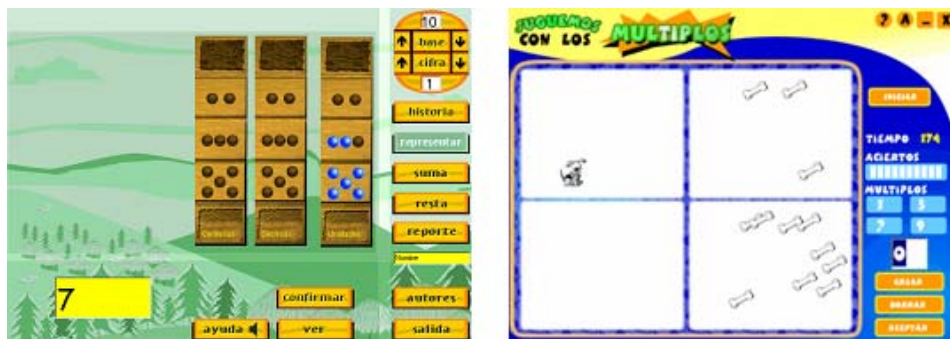
Figura 2. (a) Interface del software “La Yupana” (b) Interface de “Juguemos con los múltiplos”.

Para lograr que los niños consoliden del esquema aditivo y multiplicativo es necesario llevar a los niños paso a paso, iniciando con el reconocimiento de los números y posteriormente llevarlos a realizar actividades de composición y descomposición de ellos. Para tal fin usaremos el software “ La Yupana ”, el cual tiene como objetivo desarrollar en los niños habilidades de conteo y agrupamiento, composición y descomposición de números, conceptualización del valor posicional de los números, así como también un acercamiento al concepto de esquema aditivo y al manejo de diferentes bases de numeración.