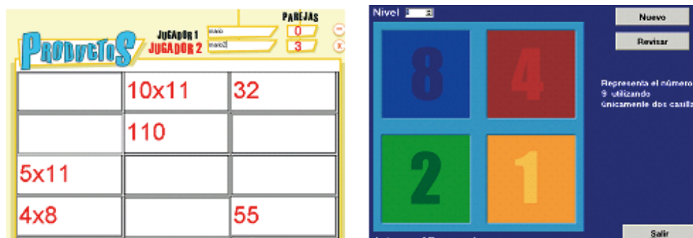
Figura 4. (a) Interface de “Concéntrate Multiplicativo” (b) Interface de “Minicomputador de Papy”.

Otra estrategia y en especial para ampliar el rango numérico es utilizar minicomputadores de 10, 20, 40 y 80 ó 100, 200, 400 y 800, y seguir las variantes o indicaciones expuestas anteriormente.