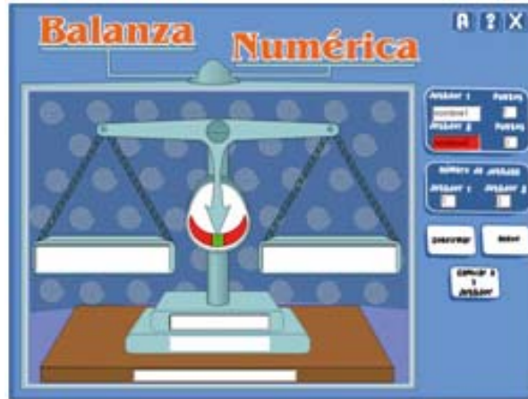
Figura 5. Interface de “Balanza Numérica”

En la balanza numérica se puede trabajar en forma individual o en grupos de a dos. Permite utilizar números naturales, enteros, fraccionarios y decimales. El software permite realizar actividades como: