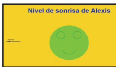
Figura 1. Carátula de la Hoja dinámica de la actividad uno.

Nuestra situación de aprendizaje, cuenta con el desarrollo de algunas Hojas Dinámicas en GeoGebra y sus correspondientes hojas de trabajo dirigidas al estudiante, de tal manera de que éste, pueda trabajar de manera autónoma, sin necesidad de que el profesor intervenga en la dicha actividad. Ahora bien, a continuación, ofrecemos algunos ejemplos de las Hojas Dinámicas que se han confeccionado para los fines antes descritos. En la figura 1 se muestra la carátula de la primera Hoja Dinámica, la cual aborda la función cuadrática de la forma Y = ax^2 + bx + c .