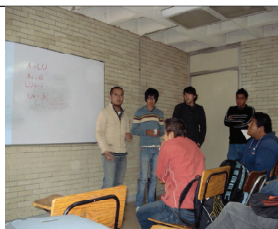
Fig.2 Presentación del tema por los alumnos del grupo de a fin de mostrar el desarrollo del algoritmo del método de descomposición LU.