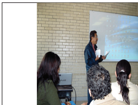
Fig.1 Presentación del tema por el profesor titular del grupo a fin de mostrar el desarrollo del algoritmo del método de descomposición LU.

La primera actividad consistió en la exposición del desarrollo para la obtención de las formulas generales del método de descomposición LU, incluyendo la solución de casos.