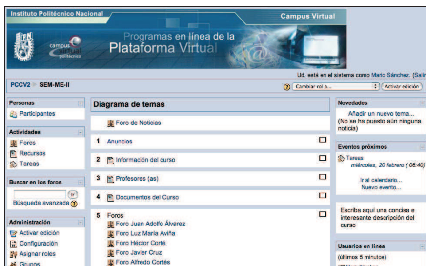
Figura 2. Página principal de uno de los cursos de Maestría del PROME en la plataforma de trabajo colaborativo Moodle