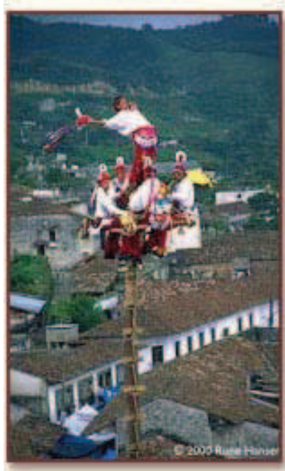
Fig. 2 El Caporal, de pie, y los voladores, sentados, listos para iniciar la danza ritual

La danza ritual de Los Voladores de Papantla se remonta a la época prehispánica. En sus inicios los trajes eran confeccionados con verdaderos plumas de aves que representaban águilas, búhos, cuervos, guacamayas, quetzales, calandrias, etc. Los voladores inician la danza desde lo alto de un tronco de árbol de 30 metros de altura que recibe el nombre de Palo del Volador. Atados de la cintura con una cuerda inician un lento descenso colgando de cabeza y girando alrededor del Palo del Volador. Mientras descienden un danzante más, que recibe el nombre de Caporal, interpreta música con un pequeño tambor y una flauta desde lo alto del palo, tan sólo manteniendo el equilibrio sin red ni cuerdas que lo protejan de una posible caída.