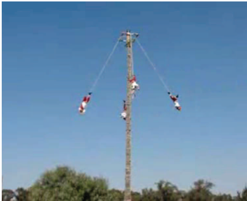
Fig. 1 Danza ritual de los voladores de Papantla, Veracruz, México.

Tomando en cuenta que las actividades deben estar basadas en el uso de la trigonometría decidimos diseñar una actividad basada en un modelo simple del movimiento que describen los Voladores de Papantla al ejecutar su danza.