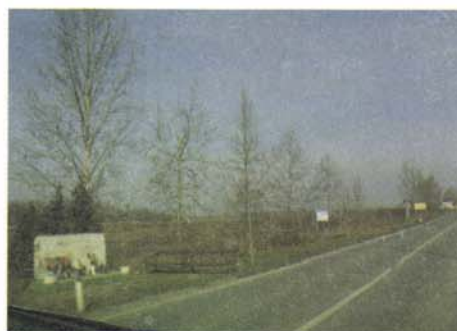
Sl. 4. Drvored platana uz sjeverni ulaz u grad; Bilje

To su jednoredni drvoredi, stari više od stotinu godina. Iako svojom impozantnošću determiniraju oblikovnu i arhitektonsku sliku grada, do danas nisu zaštićeni. Njih je prema riječima dr. Dragice Gucunski dao zasaditi grad, a povijesno su ih istražili i inventirali Manojlović i Gucunski 1997. godine. U doba kada su sađeni, uz njih nije bilo kuća, a prometnice su bili putevi za kočije i konjske zaprege. Točna lokacija spomenutih drvoreda vidljiva je iz Tablice broj 1. 3