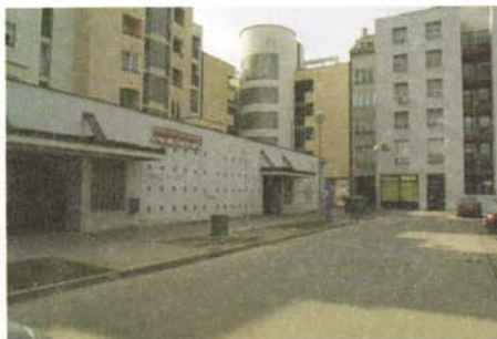
Sl. 25 i 26 Nova naselja često ne uključuju zelene površine u svoj okolni prostor-Centar Osijeka ( Blok centar II)

Radi gore napisanog, morali smo se itekako potruditi odabrati one biljne vrste koje će se zadovoljiti malim, u većini slučajeva i nedovoljnim životnim prostorom.