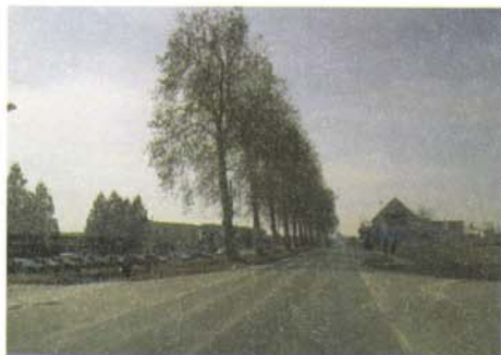
Sl. 1. Drvored platana uz južni ulaz u grad; Livana i Čepin