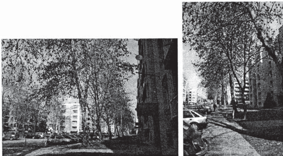
Sl. 30 i 31 Prikaz drvoreda platana u Žutom naselju u Osijeku gdje je razmak sadnje unutar drvoreda 6 m i razmak sadnje od objekta također 6 m.

drvoreda ulaze u stanove, korijenje nadiže nogostupe i drveće se nema kamo širiti, te nepravilno raste u visinu. Ne poduzima se nikakva mjera oblikovanja (slike 30 i 31).