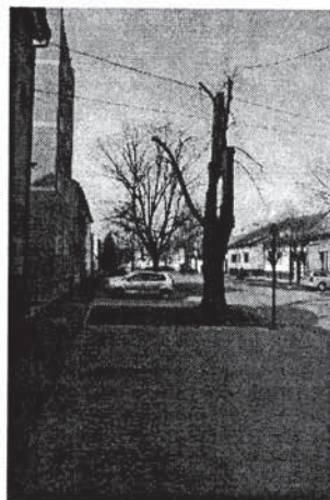
Sl. 13 i 13a Prikaz sušaca i nepravilnog oblikovanja krošnje