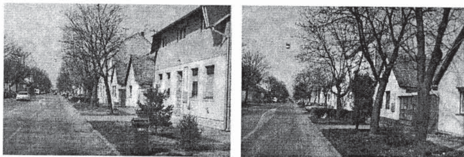
Sl. 16 i 17. Novonastali izgled zelene površine, nakon intervencije građana

Zbog takvih radnji, rijetko koji drvored u gradu ima svoj prvotni izgled i kontinuirani slijed. Čudno, ali godinama tu nitko ništa ne poduzima, pa zelene površine grada poprimaju neki novi, neprepoznatljivi oblik (slika 18 i 18a).