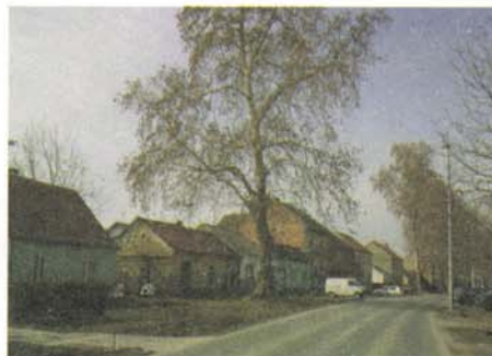
Sl. 2. Drvored platana uz istočni ulaz u grad; Višnjevac