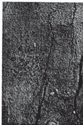
Sl. 9 i 10. Mrežasta stjenica prezimljuje pod korom, ali štetu izaziva sisanjem na listu. Zabilježeno po listu i do 200 imaga.