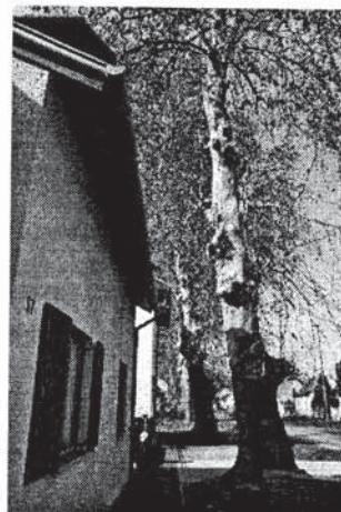
Sl. 7 i 8 Odvodni kanali presijecaju korijenje, a nogostupi režu žilište

Drvored je danas prorijeđen, neadekvatno održavan i još se uvijek sanira sječom. Gledajući struku sveobuhvatno, nalazimo sljedeću situaciju. Mnoga su stabla zbog svoje starosti i bolesti opasna i prijete vjetroizvalom, zbog trulog žilišta, trulog ksilema i bolesnog floema. Na listu je primijećen napad štetnika ponajviše mrežaste stjenice, koja doduše ne može dovesti do odumiranja jedinki, ali ih znatno imunološki oslabljuje (slika 9 i 10).