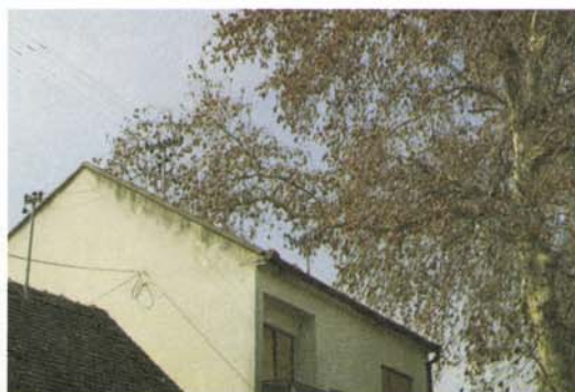
Sl. 5. i 6. Kuće u Višnjecima skoro dotiču debla, a grane padaju na el. vodove

Nove su prometnice izgrađene tako da odvodni kanali sijeku korijenje, a nogostupi režu žilište (slika 7 i 8). Nakon II. svj. rata platane su rušene radi podizanja novih raskrižja, izgradnje sportske zračne luke, stvaranja koridora za nove dalekovode.