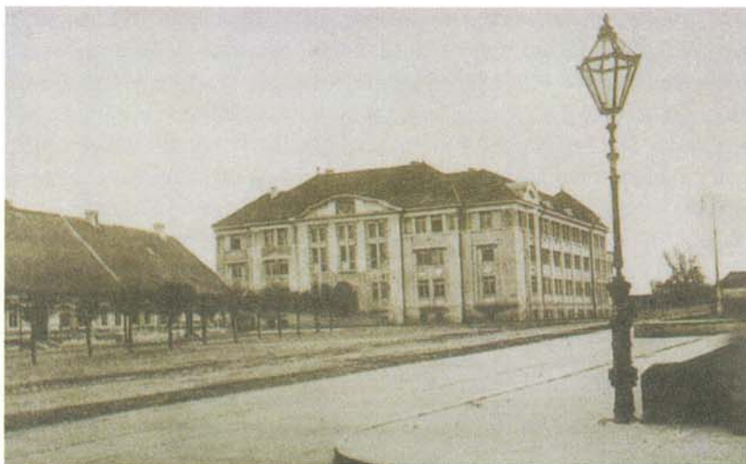
Sl. 11. Stari Strossmayerov trg, početak 19 st.

U sklopu povijesnog istraživanja perivoja u gradu Đakovu, nije mi promakla ni krajobrazna struktura Strossmayerovog trga u centru Đakova, kao ni njegova arhitektonska oblikovna osnova. Nekada dobro osmišljen trg zasađen kuglastom formom bagrema Robinia pseudoacacia 'Umbraculifera' (slika 11), danas "resi" skupina breza i crnogorice (slika 12). Mišljenja sam da bi se s obzirom na važnost okolne arhitekture ovdje morala poštivati povijesna osnova.