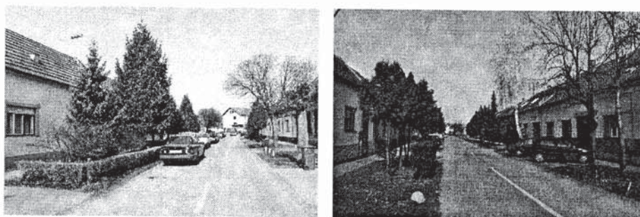
Sl. 18. i 18a U nekim dijelovima grada građani slobodno kreiraju i uređuju sve zelene površine u svojoj ulici