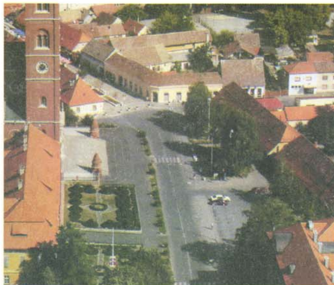
Sl. 12. Strossmayerov trg danas