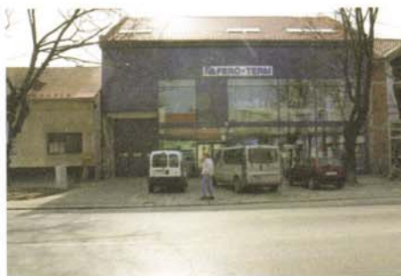
Sl. 14 i 15. U gradu svakodnevno niču nova parkirališta, a drvoredi nestaju