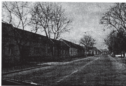
Sl. 27, 28 i 29 Prikaz Gundulićeve ulice u Osijeku i krajobraznog uređenje jedne od važnijih prometnica grada

U susjednim su ulicama (Hebrangovoj i Kanižličevoj) posađeni drvoredi lipa. Poznato je da je lipa alergen i da loše djeluje na rad srca. Koncentracija mirisa i peluda u doba cvatnje (gotovo cijeli mjesec lipanj) je takva, da mnogi moraju u to vrijeme otići iz svojih stanova.