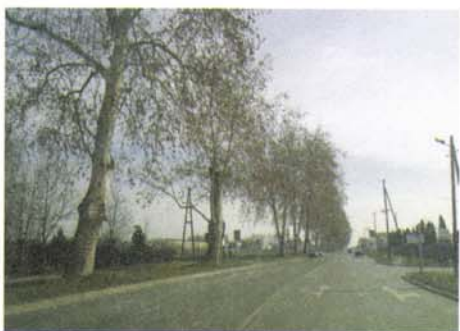
Sl. 3. Drvored platana uz zapadni ulaz u grad; Nemetin