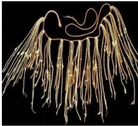
Figura 2. Fotografía de uno de los pocos ejemplares de quipus que aún subsisten.

Y volviendo a América del Sur, la civilización andina crea y organiza hacia el siglo XII de nuestra era el Imperio de los Inca. Es a partir de esa época, que aparece el célebre quipu , consistente en una cuerda de lana tejida (en posición horizontal), de la cual cuelgan cuerdas con nudos como instrumento para contar y llevar inventarios de alimentos, por ejemplo. Diferenciados por su lugar en la cuerda perpendicular y además distinguidos por colores de lana teñida, la nada ó el 0 se reconocía al dejar un espacio libre entre nudos. Ver Figura 2.