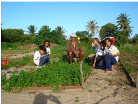
Figura 1. Alunos do 5º ano da Escola Mun. Profª. Lourdes Godeiro entrevistando um dos horticultores da comunidade de Gramorezinho.

Após esses esclarecimentos ao leitor, vou adentrar no contexto da ação pedagógica realizada com os alunos do 5º ano do ensino fundamental da escola daquela comunidade. Vale salientar que nem todos aqueles alunos trabalhavam com hortaliças ou tinham pais horticultores. Então, foi necessário levá-los a visitar as hortas da comunidade, como mostra um desses momentos a Figura 1, com o objetivo de observar os afazeres diários dos horticultores com o manuseio das hortaliças, além de entrevistá-los.