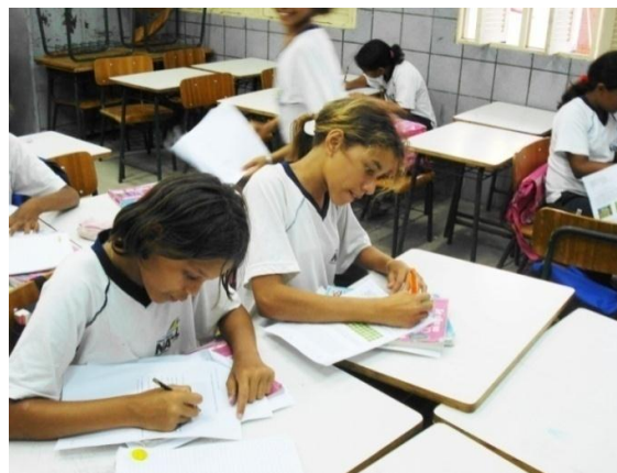
Figura 2. Alunos do 5º ano do ensino fundamental da Escola Municipal Professora Lourdes Godeiro em atividades pedagógicas.

A seguir, aos alunos foi atribuída a tarefa de contar objetos utilizando o “par de cinco” (Ver Figura 2). Os alunos que tinham mais familiaridade com o cotidiano da horta auxiliaram aqueles que tiveram dificuldades de compreender a ideia por trás do “par de cinco”. Em outros momentos, foi trabalhada a contagem não de cinco em cinco, mas em outros agrupamentos, tais como, de três em três, de quatro em quatro.