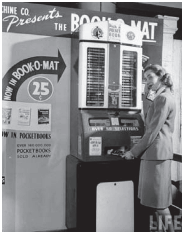
Book-O-Mat, 1949. LIFE.

On the other hand, this situation seems to question the face-to-face services of the library. As automation advances (auto-loan machines, virtual catalogues, distance reference services...), the usefulness of the librarian (and that of libraries, of course) is called into question. Personnel reduction, uncared customers... the human dimension of libraries is excluded.