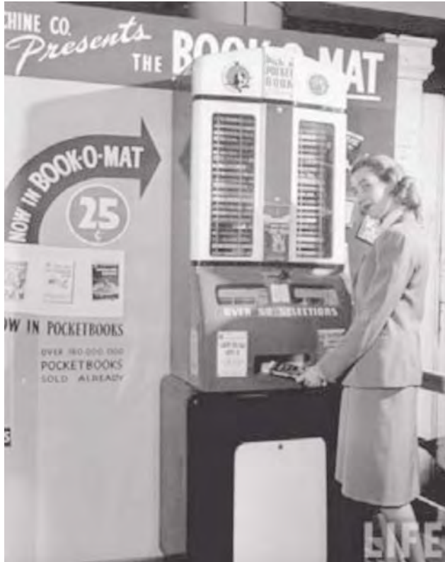
La Book-O-Mat expendedora de libros en 1949. Revista LIFE.

Por otra parte, esta situación parece poner en entredicho los servicios bibliotecarios presenciales. A medida que se desarrolla el automatismo (máquinas de autopréstamo, catálogos virtuales, servicios de referencia a distancia...), se cuestiona la utilidad del bibliotecario y, claro está, la de las propias bibliotecas.