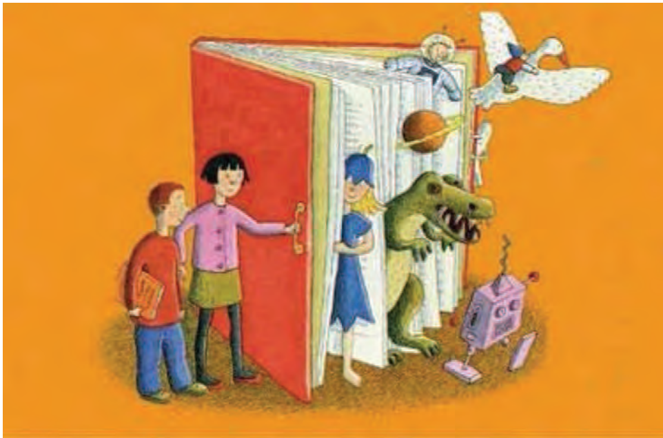
Illustration: Leena Lumme. Finnish stamp.

Amongst all the reading-related metaphors, my favourite is the "door". I brought twenty of them to Jumilla, in order to share them with you, as I find yours widely open for me.