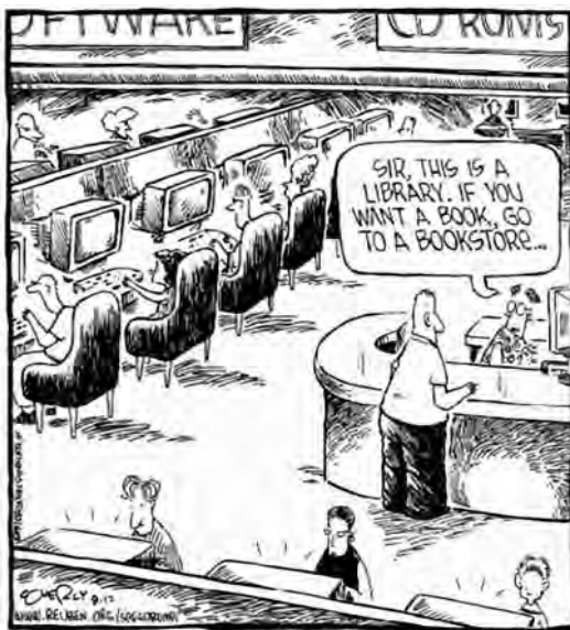
Imagen: Dave Coverly.