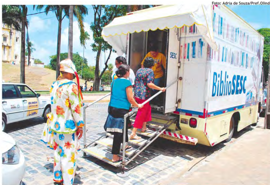
Imagen: Biblioteca móvil em Olinda, Pernambuco, Brasil.

...acercar los libros y la lectura a quienes más difícil lo tienen. La biblioteca debe ser una ocasión para acceder a la información y a la cultura.