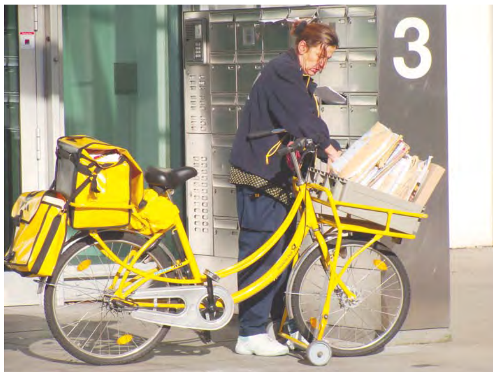
Imagen: Post cycle Cologne

... también un medio para comunicar individualidades: la del autor y el lector, las del ayer y el hoy, las de culturas remotas,