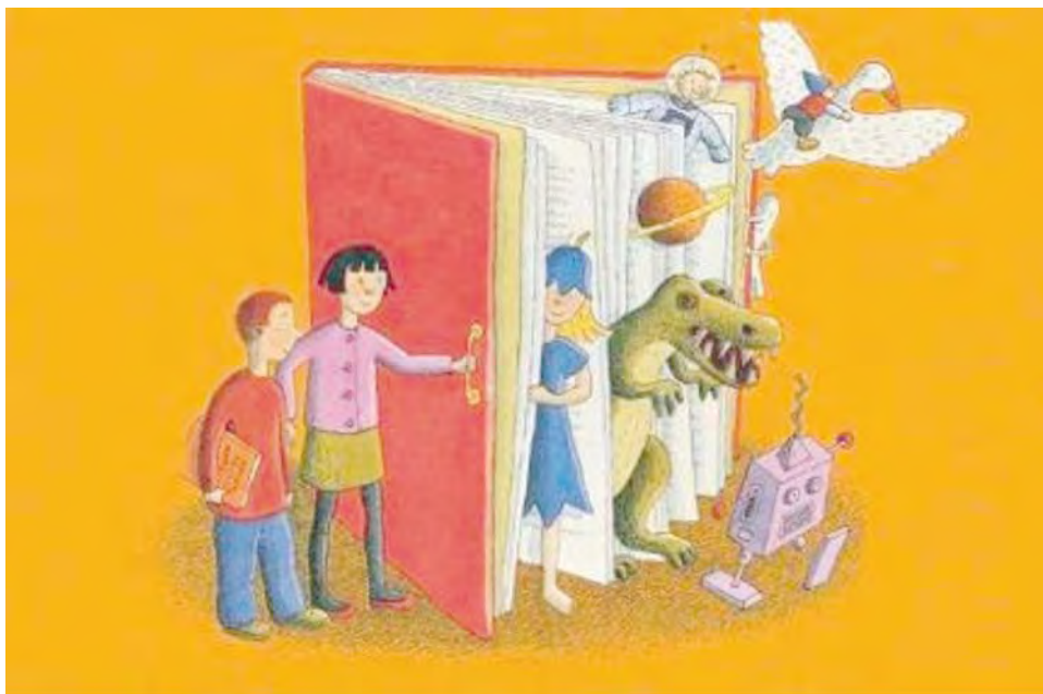
Ilustración de Leena Lumme. Sello conmemorativo del primer centenario de la Asociación finlandesa de bibliotecas.

De entre todas las metáforas relacionadas con la lectura y las bibliotecas, mi favorita es la de la "puerta". Por eso me he traído veinte de ellas a Jumilla, para compartirlas con vosotros, que me recibís con las vuestras abiertas de par en par.