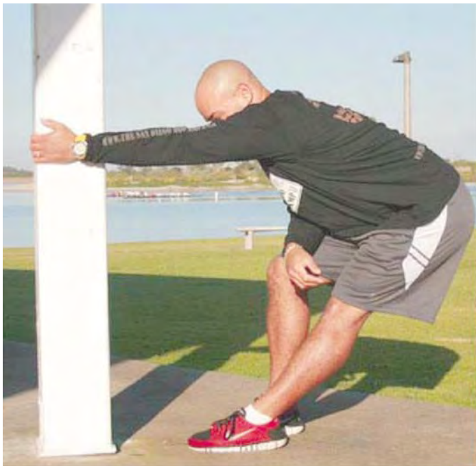
Imagen: sin créditos.

Tomada de http://www.obsessyourself.com/author/admin/