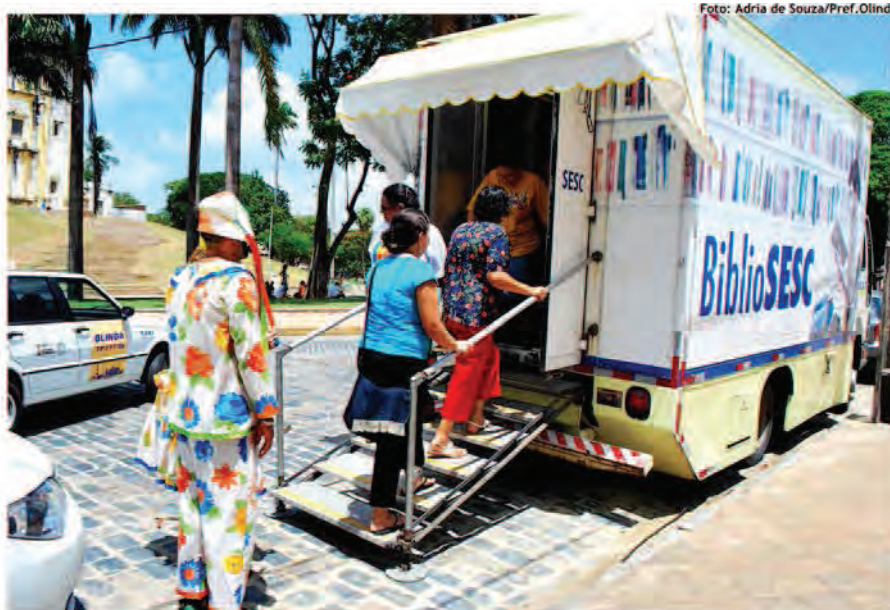
Image: Biblioteca móvel em Olinda, Pernambuco, Brasil.

Bringing books and reading close to those who face the greater difficulties in accessing them.