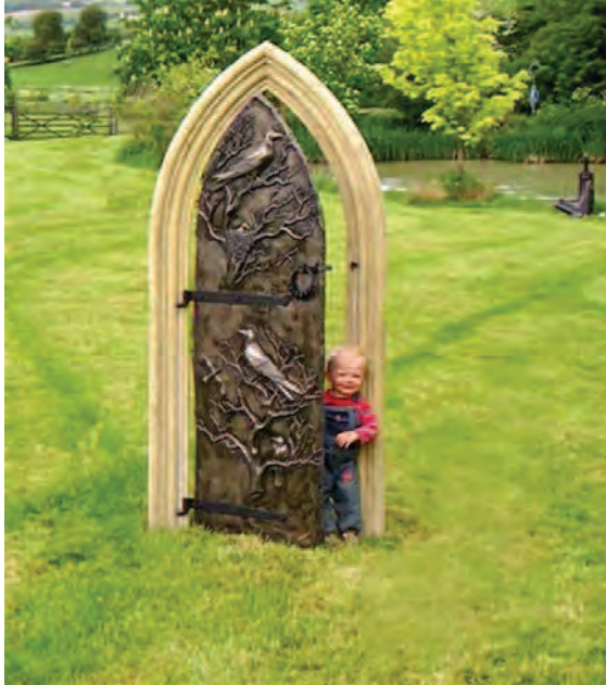
Image: Secret Garden Door.

It can also fill our head with questions