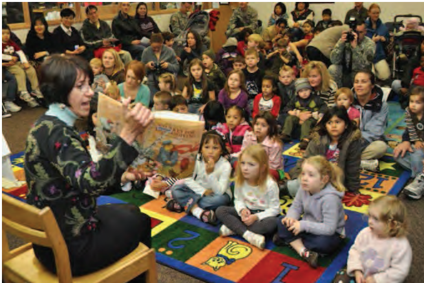
Imagen: Youngs at Library.

The same as now. Opening doors. Communicating people. Offering HUMAN VALUE to society.