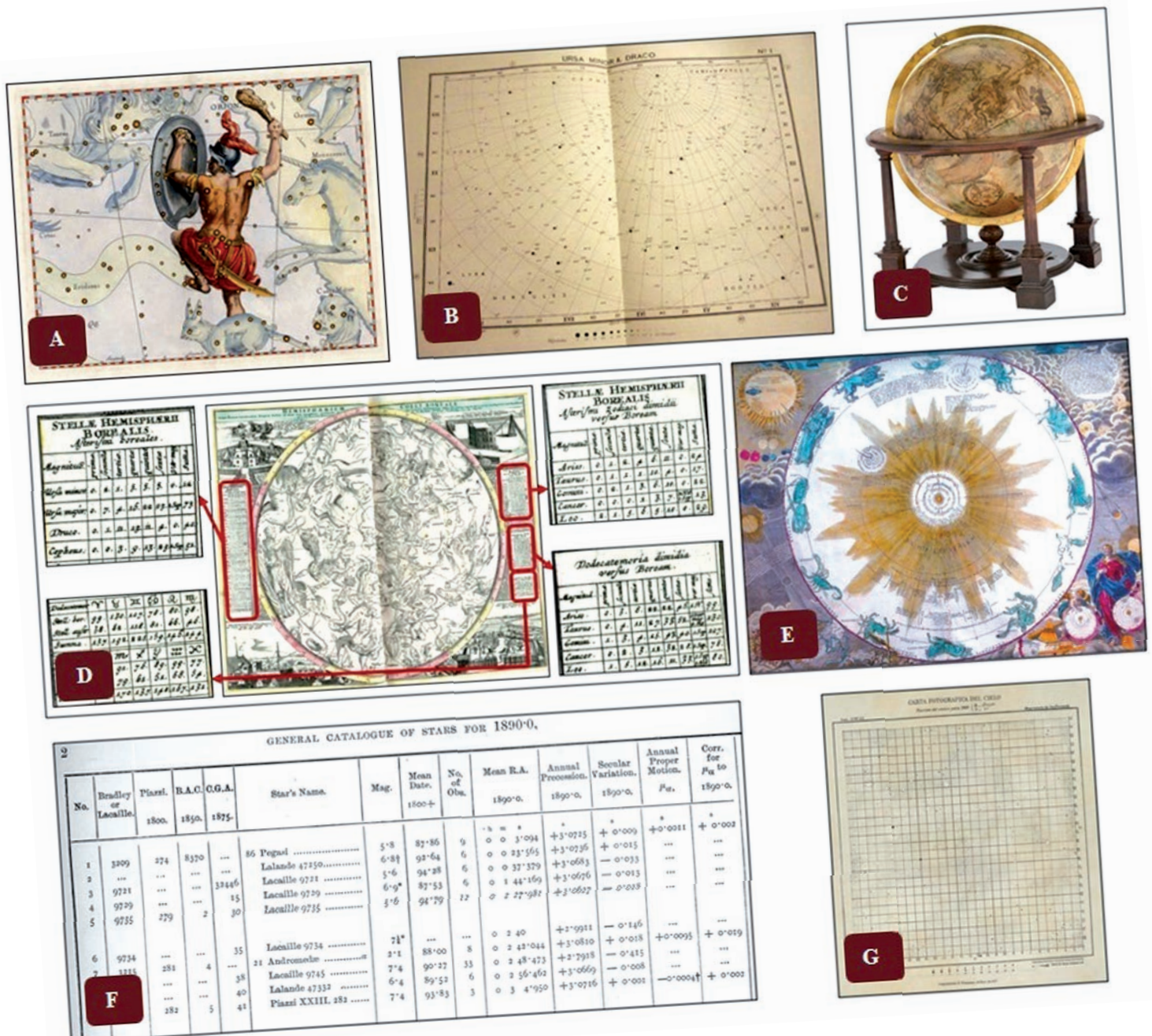
FIGURA 1 Algunos documentos astronómicos históricos: (A) Carta celeste pictórica (Hevelius, 1690). (B) Carta celeste no pictórica (Cottam, 1889). (C) Globo celeste (Mercator, 1551). (D) Planisferio-catálogo (Doppelmayr, 1742). (E) Carta cosmológica (Doppelmayr, 1742). (F) Tabla principal de un catálogo celeste (Gill, 1898). (G) Carta fotográfica del cielo (ROA, 1923).