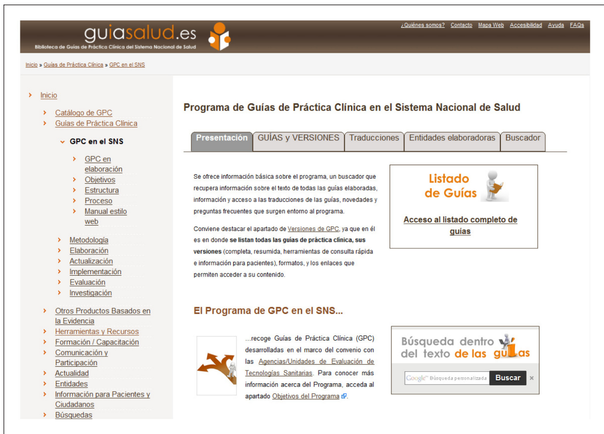
Figura 1. Pantalla de acceso al portal guiasalud.

El objetivo Programa de GPC en el SNS es promover la elaboración, actualización, difusión e implementación de guías en el Sistema Nacional de Salud.