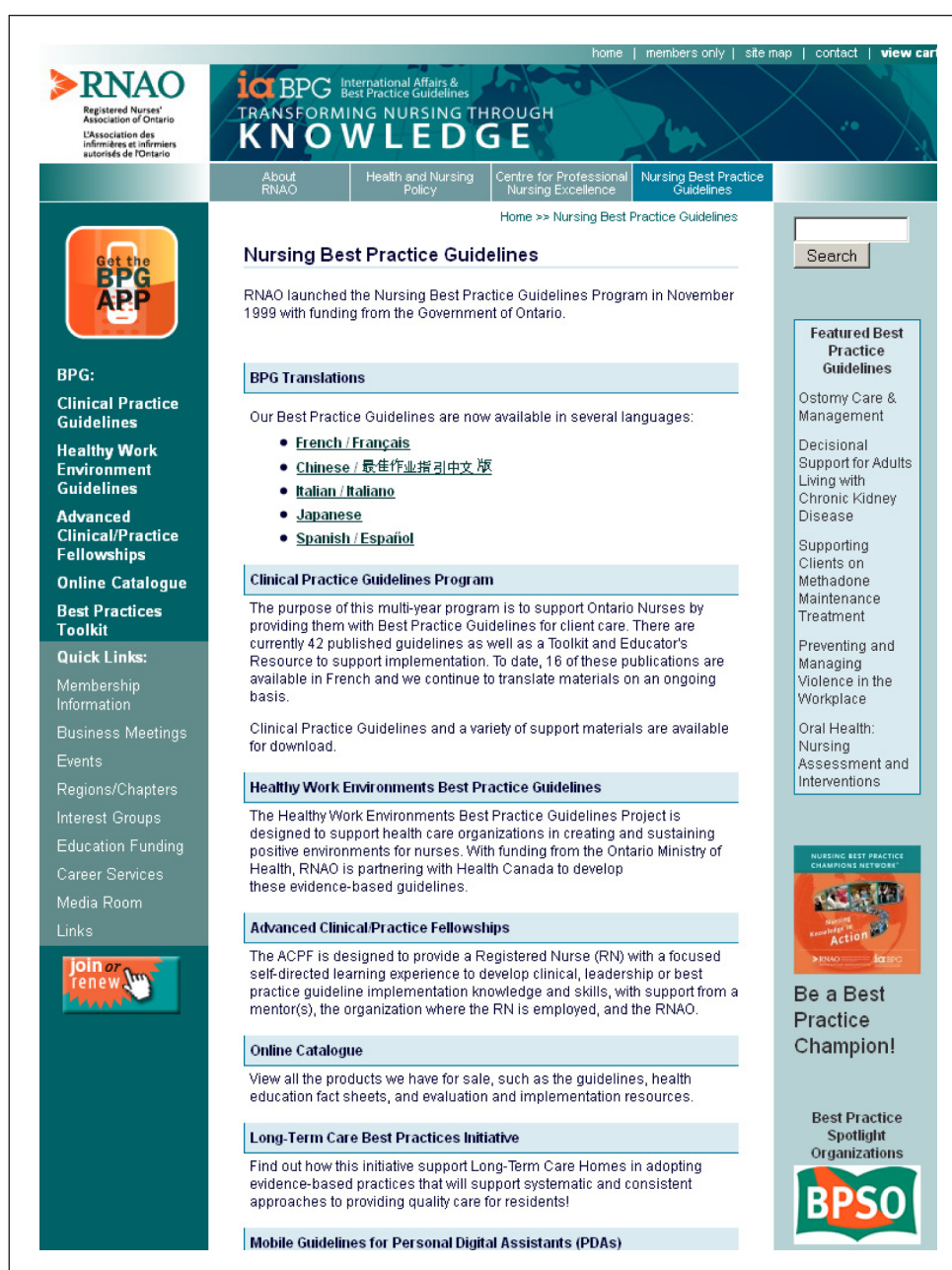
Figura 3. Pantalla de acceso a RNAO.

Cabe destacar que algunas de ellas han sido traducidas al español gracias a un convenio entre la RNAO, Investén y el Instituto de Salud Carlos III. Estas traducciones pueden consultarse desde el siguiente enlace: http://www.rnao.org/Page.asp?PageID=861&SiteNodeID=133