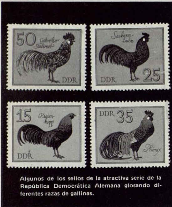
Algunos de los sellos de la atractiva serie de la República Democrática Alemana glosando diferentes razas de gallinas.

Sí, concretando un poco más, nos vamos hacia el tema de las aves, vemos que es también enormemente extenso y con una ventaja sobre gran parte de los otros: la enorme variedad de especies diferentes que pueden brindarnos numerosos países acabados de ingresar en la Comunidad de Naciones que, faltos tal vez de los recursos o el acervo cultural de los de solera, desean exhibir al menos sus grandes riquezas naturales.