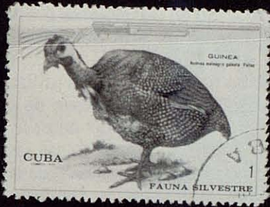
Tres sellos más de una serie de Cuba —1970— dedicada a la fauna silvestre.

gerencias que nosotros nos atreveríamos a brindar al Servicio Filatélico de Correos para que las tuviera en cuenta en los sucesivos.