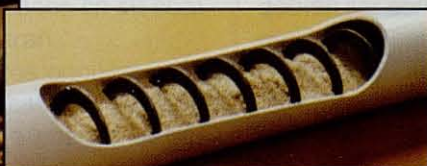
Sistema de Transporte de Alimento FLEX-AUGER®