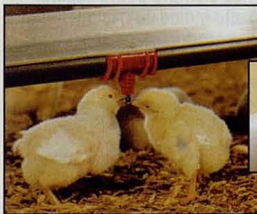
Bebedero de Boquilla