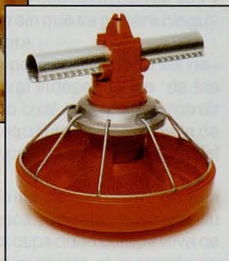
Comedero de Uso General Modelo G™