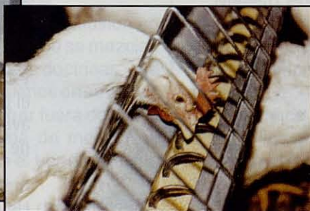
Comedero ULTRAFLO® para Reproductoras