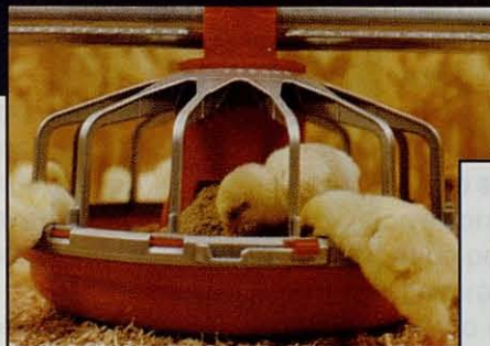
Comedero Modelo C2™ para Pollos de Engorde