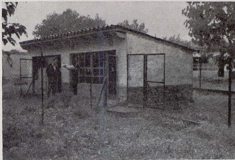
Fig. 1. Conejares de la Excma. Diputació Provincial de Barcelona en la Granja Escola Experimental de Caldas de Montbuy.

dan contar con sus resultados antes del día 20, para que los mismos no pierdan actualidad y, por tanto, interés.