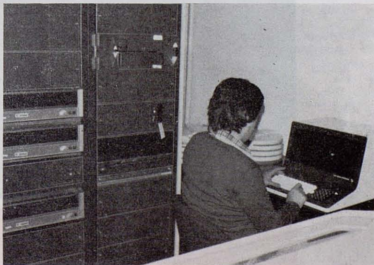
Fig. 2. Ordenador utilizado por el Centro de Gestión Técnico-Económica de Explotaciones Cunicólicas, perteneciente a la Sección de Cálculo del Servicio de Cartografía y Fotogrametría de la Excma. Diputación de Barcelona.

El cunicultor, con estos índices sobre su explotación, tiene un conocimiento muy real sobre la marcha de la misma, que unido al estado particular de los animales, camadas y lotes de cebo a través de las fichas correspondientes, le proporciona un conocimiento exacto de la granja, lo cual se hace cada vez más necesario en cualquier actividad económica de nuestros días.