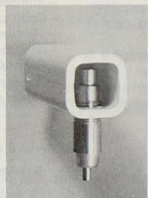
Bebedero de chupete acero inox.