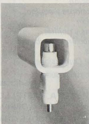
Bebedero de chupete