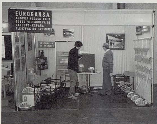
El stand de otra firma española que completaba la muestra de los de nuestro país, aparte de los de material cunícola.

En fin, como puede verse, por mas que algunos críticos -que siempre los hay- dirían de esta manifestación ferial que, por su tamaño, no puede compararse con otras europeas, nosotros creemos que su visita nunca deja de ser interesante, máxime si uno la puede combinar con la del ya mencionado Salón de la Agricultura. Y digamos por último que, según las últimas informaciones que recogimos del Simavip, para 1991 se proyecta nuevamente trasladar éste a su emplazamiento original, es decir, a la Puerta de Versalles, en coincidencia de fechas con el Salón de la Agricultura de Marzo. Si ello será para bien o para mal, el tiempo lo dirá, cabiendo apuntar sólo que cabe confiar en que el Simavip termine por encontrar su rumbo definitivo, hasta ahora más bien errático a causa de los cambios de lugar y de fechas a que ha sido sometido. □