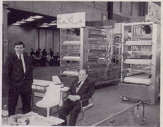
Las magníficas baterías de puesta de una firma navarra, que pueden codearse tranquilamente con las mejores extranjeras.

-Las baterías para el engorde forzado de patos para la producción de "foie-gras", junto con los equipos correspondientes para el embuchado de éstos.