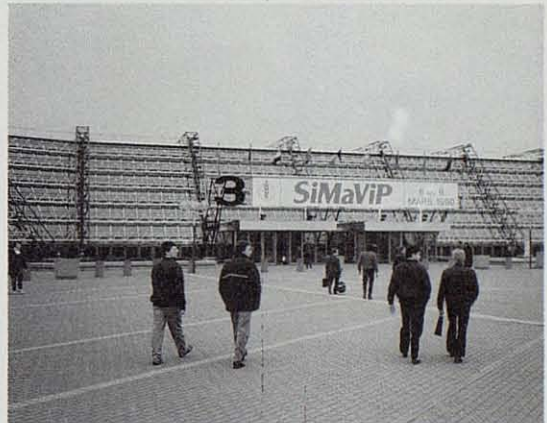
Vista parcial de la moderna construcción del parque de exposiciones en donde se desarrolló la SIMAVIP.

de que, aún habiendo esperándose una cifra de visitantes superior a los 12.000, la amplitud de sus pasillos y los espacios libres que había permitían una visita de la Feria sin ningún agobio. En otro salón contiguo tenía lugar, simultáneamente, el Sitepal, primer Salón Internacional de las Tecnologías y Equipos de la Alimentación Animal y las Industrias Agroalimentarias, organizado también en conjunción con el Salón de la Agricultura.