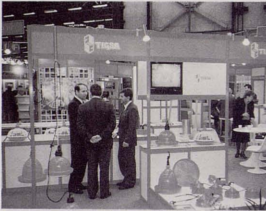
Stand de una de las empresas catalanas de vanguardia en material y equipamientos avícolas, presente en la SIMAVIP 90.

En lo que a la exposición en concreto se refiere, del total de 250 expositores que participaban en ella, una buena proporción pertenecían o se hallaban ligados de una forma u otra al sector avícola. Y, dentro de éste, como ya es habitual en las manifestaciones de este tipo, los fabricantes de equipos avícolas eran los que ocupaban el lugar más destacado, lo cual no excluye el que de los representantes de las granjas de selección productoras de pollitas para la puesta, aves pesadas, pavos, patos o pintadas no faltase prácticamente ninguna de todas aquellas que tienen una dimensión multinacional.