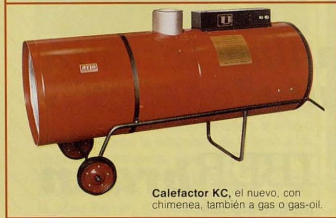
Calefactor KC , el nuevo, con chimenea, también a gas o gas-oil.