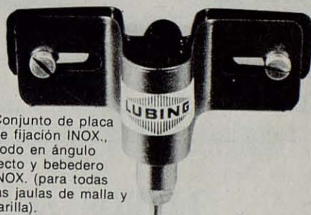
Conjunto de placa de fijación INOX., codo en ángulo recto y bebedero INOX. (para todas las jaulas de malla y varilla). Ref. 9.003