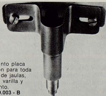
Conjunto placa fijación para toda clase de jaulas, malla, varilla y cemento. Ref. 9.003 - B