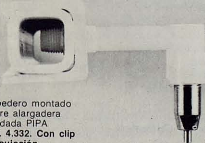
Bebedero montado sobre alargadera acodada PIPA Ref. 4.332. Con clip de sujeción.