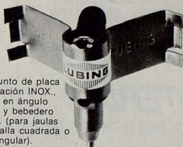
Conjunto de placa de fijación INOX., codo en ángulo recto y bebedero INOX. (para jaulas de malla cuadrada o rectangular). Ref. 9.002