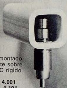
Bebedero montado directamente sobre el tubo PVC rígido 22 x 22 INOX. Ref. 4.001 TUBO. Ref. 4.101