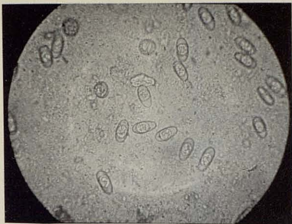
Microfotografías de Eimerias del conejo en forma de ooquiste.

dos, amén de otras anomalías endógenas que causan agalactia de las madres.