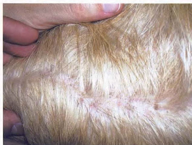
Figura 8. Zona cervical a los 21 días de tratamiento.