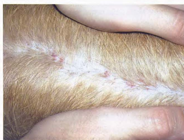
Figura 9. Dorso de la cabeza a los 90 días de tratamiento.

Como comentario de este informe podemos concluir que las lesiones que desarrolla este animal a nivel cutáneo corresponden a focos de dermatitis frente a la presencia de áreas