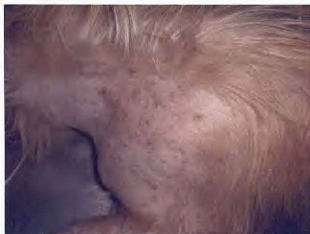
Figura 3. Afección papulo-pustular en región de la espalda, primera visita.

Esta histopatología se corresponde con una dermatitis perivascular hiperplásica con múltiples focos de displasia compatible con infección por Straelensia .