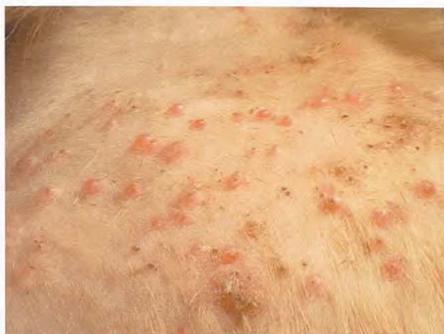
Figura 4. Zona cervical dorsal visión cercana. Día de la 1º visita.