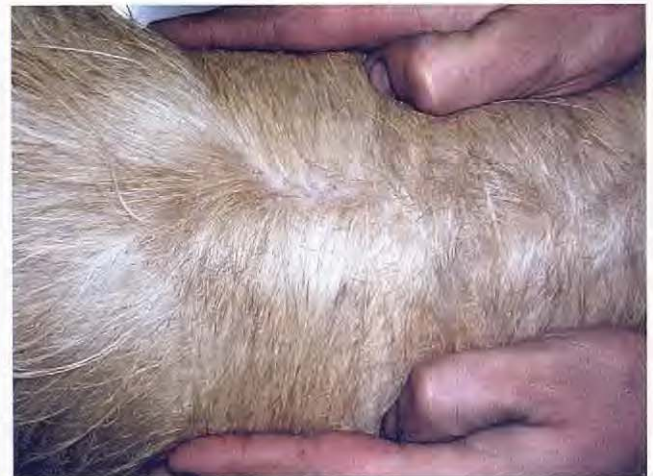
Figura 11. Zona cervical a los 90 días de tratamiento.

Con respecto al tratamiento y dada la poca experiencia que existe en esta enfermedad con diferentes drogas acaricidas, será interesante probar con la eficacia de nuevas opciones terapéuticas como avermectinas y milbemicinas de última generación.