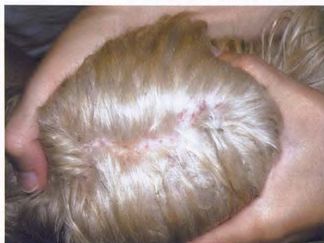
Figura 7. Dorso de la cabeza a los 21 días de tratamiento.