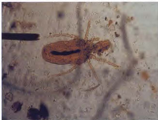
Figura 1. Larva de Strelensia cynotis .

En el informe histopatológico se describen múltiples focos de leve hiperplasia epidérmica con la presencia de áreas de fuerte hiperplasia y displasia del tejido epitelial asociados a zonas de invaginación dentro del tejido dérmico, sin fragmentación de la membrana basal, que internamente aparecen ocupados por un tejido con características de cutícula parasitaria. La dermis adyacente a estos focos de displasia desarrolla una fuerte inflamación de carácter mononuclear. (Figs. 5 y 6)