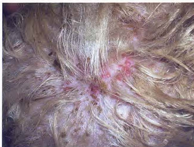
Figura 2. Dorso de la cabeza, primera visita.