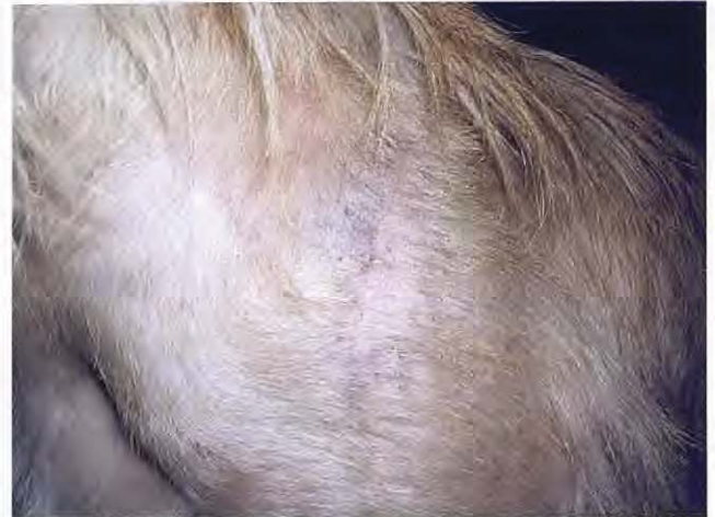
Figura 10. Zona de la espalda a los 90 días de tratamiento.

Por otro lado, es probable que estas lesiones puedan estar complicadas con un componente bacteriano, ya que los sucesivos antibióticos aplicados en este caso lograban mejorar el cuadro.