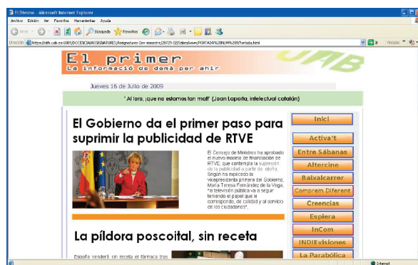
Figura 1: Reproducción de una de las portadas del ciberdiario

Asimismo, se apuesta por la utilización del Campus Virtual 1 para alojar allí artículos extraídos de publicaciones, tanto en papel como digitales, en los que se abordan temas de actualidad vinculados a la comunicación. Estos materiales tienen, por decirlo de alguna forma, una base muy profesional y no tan teórica como los que han podido leer en otras