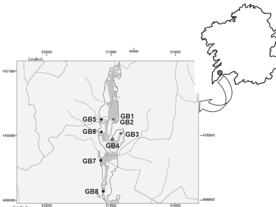
Figura 1. Localización de los puntos de muestreo dentro de la zona LIC. Location of the sampling points in the LIC area.

Louro. Este valle es una importante zona de tránsito entre el norte de Portugal y las Rías Bajas, lo que motivó la construcción de dos importantes vías de comunicación que discurren paralelas: el ferrocarril Vigo-Monforte y la autovía A-55; que han tenido como consecuencia la fragmentación del humedal, actualmente dividido en dos. Además, cabe destacar que se trata de una zona muy afectada por diversas actividades antropogénicas, siendo el impacto más grave, junto con las ya citadas infraestructuras, la actividad de un polígono industrial cercano. Los vertidos aportan al ecosistema diversos tipos de contaminantes ajenos a éste, que no reciben el adecuado tratamiento de descomposición e integración en los ciclos biogeoquímicos (Silva-Pando et al. , 1987).