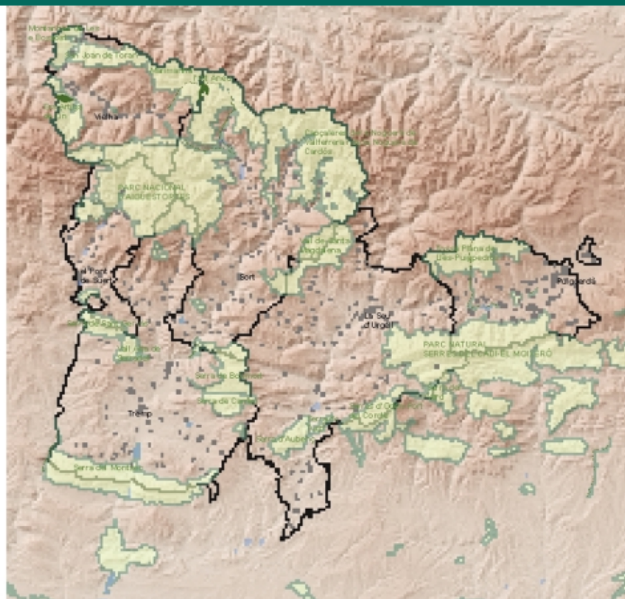
Figura 2 Espais d'interès natural

Font: Elaboració pròpia a partir de la base cartogràfica de l'ICC.