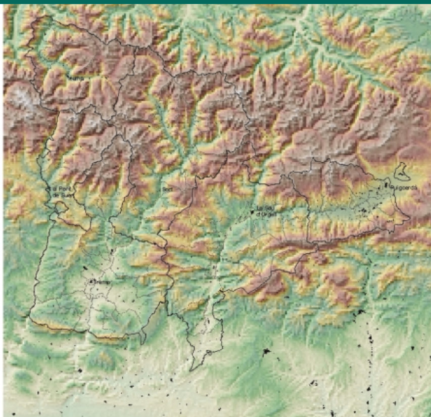
Figura 1 Mapa de situació i hipsomètric