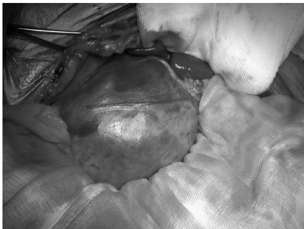
Fig. 2 - Reperto intraoperatorio.