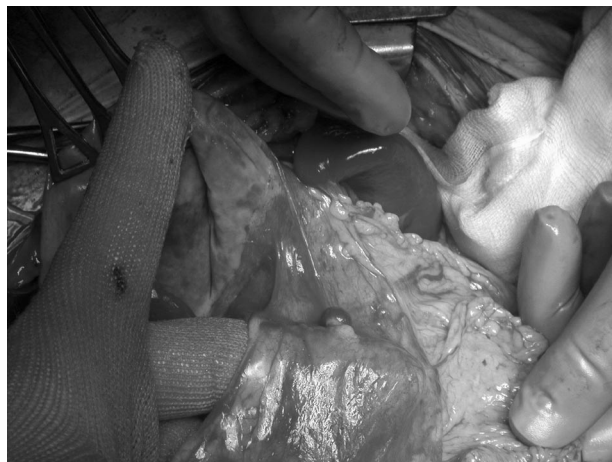
Fig. 3 - Reperto di milze accessorie.

La diagnosi è quasi sempre accidentale, di regola in corso di esplorazione ecotomografica dell'addome. L'ecografia dell'addome consente, oltre alla identificazione della formazione e della sua sede, la diagnosi differenziale tra massa parenchimale e formazione cistica. È possibile anche lo studio del profilo diaframmatico a dimostrazione di eventuali coinvolgimenti pleurici o unicamente toracici di tipo infiammatorio o semplicemente reattivo (5, 6).