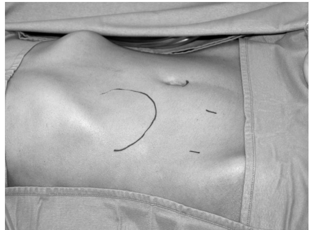
Fig. 2 - Individuazione della posizione dei trocars rispetto alla lesione.