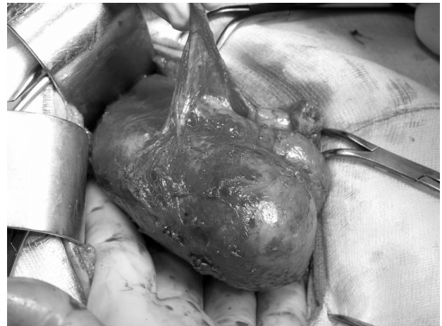
Fig. 3 - Pezzo operatorio.