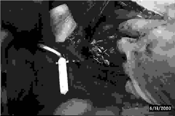
Fig. 3- Al termine dell'intervento 1/3 della parete anteriore del retto si presenta libero dal patch.

però potrebbe essere utile per non creare una torsione dell'intestino spesso causa di un'occlusione intestinale postoperatoria. La breccia mesenterica è stata quindi chiusa con sutura continua e dopo aver posizionato il drenaggio si è proceduto a chiudere la laparotomia. I quattro pazienti hanno avuto decorso postoperatorio regolare; solo in un caso c'è stato un ritardo della canalizzazione avvenuta in VII giornata. Il follow-up, che si estende a circa un anno, mostra risultati soddisfacenti, con assenza di recidiva e di disturbi dell'evacuazione, e con recupero psicologico del paziente e della sua funzione ano-rettale.