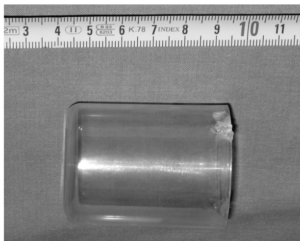
Fig. 2 - Caso n. 1 - Reperto operatorio. Tappo in plastica dura di una bomboletta spray di deodorante rimossa per via transanale dall'ampolla rettale.