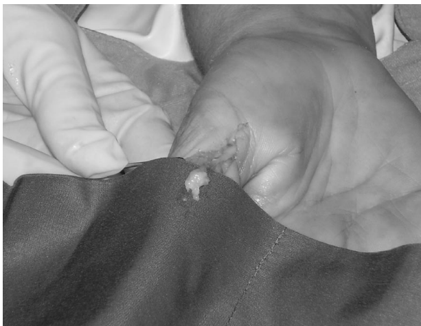
Fig. 2 - Isolamento neuroma.