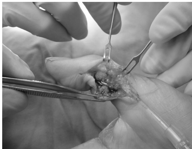
Fig. 3 - Applicazione Hyaloglide®.