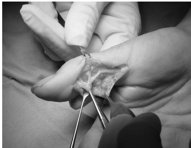
Fig. 1 - Isolamento nervo digitale laterale.

Tutti i pazienti riprendevano comunque entro 2 settimane le attività lavorative con giudizio positivo in 5 pazienti; solo un paziente lamentava occasionale comparsa di Tinel doloroso nello svolgimento delle attività manuali gravose, ma di intensità tale da non impedirne il regolare svolgimento.