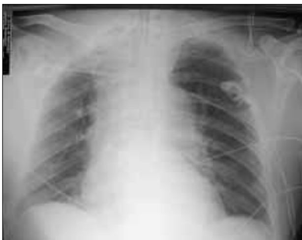
Fig. 1 - Rx torace (a letto): evidente e marcato slargamento mediastinico bilaterale causato dalla presenza di raccolte purulente in un caso di DNM.