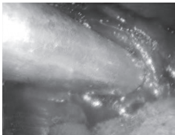
Fig. 3 - Cannula per aspirazione sulla piccola incisione della parete cistica.

Si realizzano a questo punto una parziale cistectomia della cupola della cisti e una ispezione sotto visio-