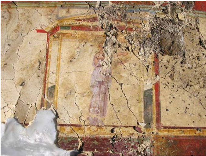
Fig. 3. Un frammento della parete S del corridoio dopo il sollevamento