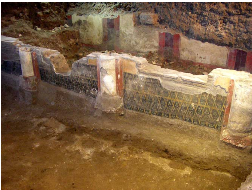
Fig. 2. Veduta del corridoio e del viridarium

Questa strutturazione riutilizza in età medio-imperiale una volumetria già definita in epoca augustea da due strutture parallele, di cui quella a sud con grandi finestre e quella a nord articolata con semicolonne sul lato esterno, rivolto verso un'area destinata a giardino 4 .