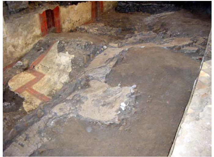
Fig. 4. Crollo delle pareti e del soffitto del corridoio

locus religiosus , in quanto si riteneva che Iuppiter Fulgur lo avesse scelto per manifestare la sua potenza dedicandolo a se stesso. All'interno del bidental si doveva condere fulmen , cioè seppellire il materiale colpito dal fulmine. La sepoltura doveva essere a cielo aperto, in modo che fosse in contatto con il cielo, e circondata in superficie da un riparo visibile, perché non fosse né vista né calpestata. Questo ritrovamento, ancora in corso di studio, aggiunge ulteriore interesse alla già eccezionale importanza dei rinvenimenti, in quanto questi monumenti, e soprattutto quelli di tipo privato come il nostro, sono assai rari 9 .