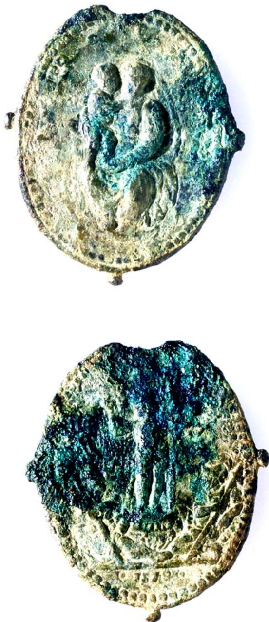
Fig. 1. Medaglietta del 1579. Fronte con Vergine in trono con Bambino, retro con probabile Risurrezione.

Risulta, dagli atti delle Visite Pastorali cinque-seicentesche, che nel VII secolo l'arcivescovo di Milano San Giovanni Bono edificò, nell'area dell'attuale via Pio XI, una chiesa, articolata su tre navate ed orientata E-W, dedicandola ai Santi Siro e Materno, la cui costruzione doveva essere connessa con l'opera di conversione delle popolazioni longobarde.