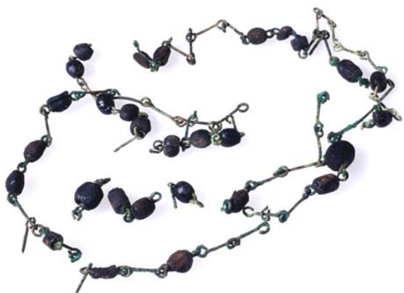
Fig. 2. Frammenti di rosari con grani di legno.