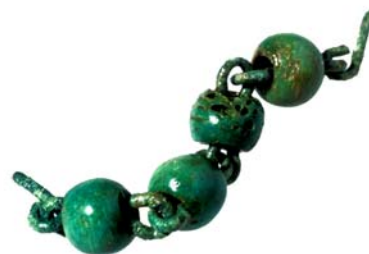
Fig. 3. Frammenti di rosari con grani in osso.