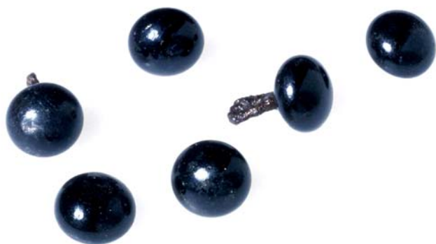
Fig. 4. Bottoni di pasta vitrea nera per abiti talari.