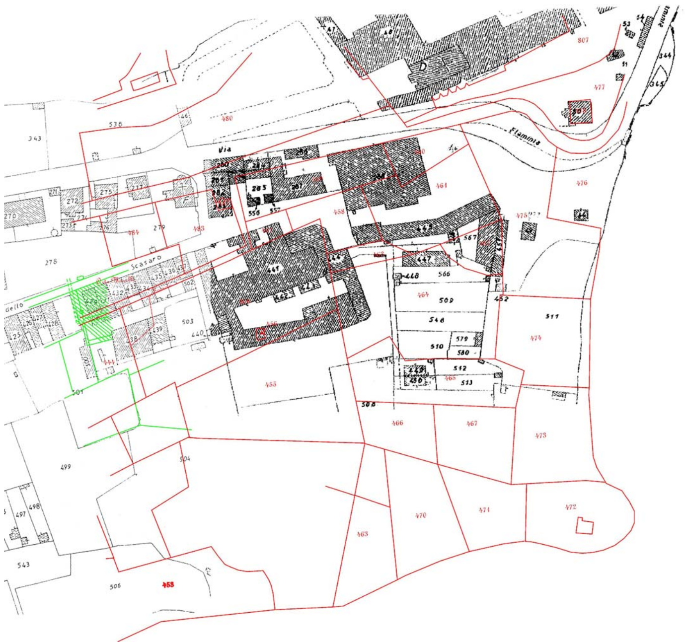
Fig. 3. Scasato. Stralcio Foglio catastale n° 30 (Scala 1:1000). In rosso l'antico Catasto Gregoriano.

Ancora ad ambito funerario è ascrivibile una fossa individuata nel settore B, US 32; è orientata nord-ovest/sud-est, di forma rettangolare e con frontoncino lungo la parete corta meridionale, munita di una risega lungo il lato occidentale