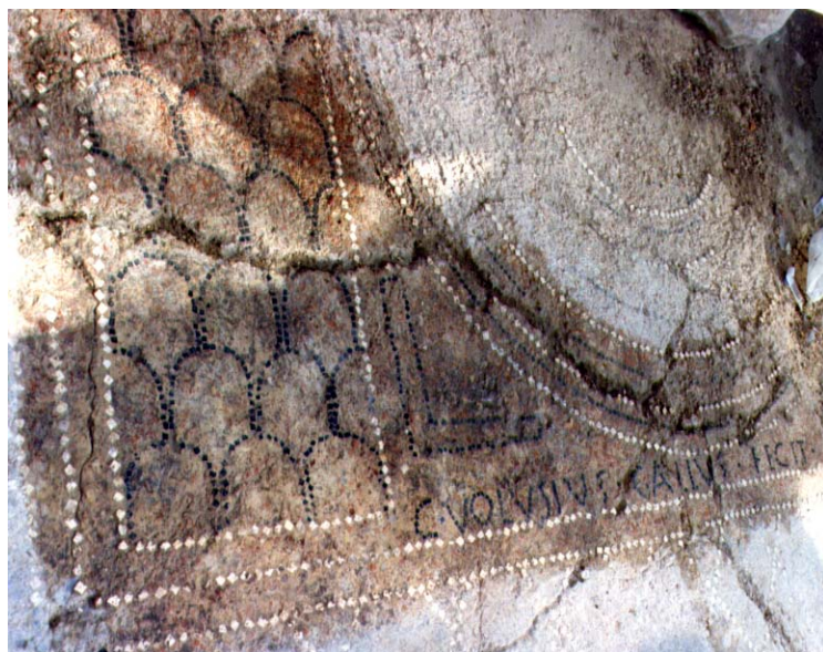
Fig. 3. Morrone del Sannio Casalpiano. Pavimento musivo con iscrizione.