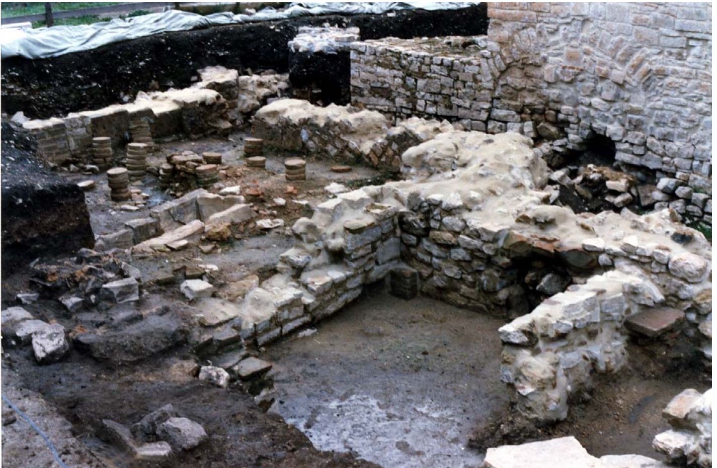
Fig. 4. Morrone del Sannio Casalpiano. Ambienti termali dell'insediamento rustico.

oggetti rinvenuti sono riferibili all'abbigliamento del defunto (fibbie in bronzo e in ferro) e raramente sono costituiti da suppellettile vascolare, ornamenti (bracciali in bronzo, perle in pasta vitrea) e monete, databili dalla fine del VI/VII secolo d.C.