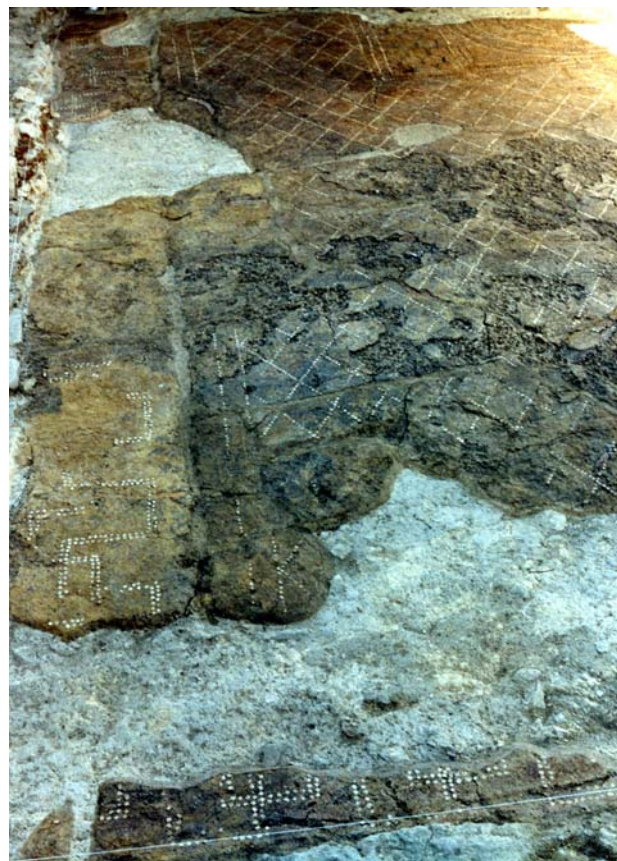
Fig. 2. Morrone del Sannio Casalpiano. Pavimento in opus signinum .

Informazioni sui proprietari della villa sono fornite da tre iscrizioni. Al centro di un ambiente, sul pavimento musivo, tagliato dall'edificio diruto della chiesa maggiore, è stata rinvenuta l'iscrizione C(aius) VOLVSIVS GALLVS FECIT (fig. 3). La gens Volusia è attestata con frequenza a Roma, in Campania, sulla fascia adriatica dal Picenum all' Apulia e verso i confini interni ( Telesia , Amiternum ) della regio IV (Samnium) 2 . Su un'ara votiva in pietra calcarea era riportata la dedica di un liberto – C. Salvius Euthychus - ai Lari Casanici per il ritorno della padrona Rectina 3 . Resta al momento una pura ipotesi l'identificazione, che ne è stata proposta, con il personaggio scampato all'eruzione del Vesuvio del 79 d.C. e salvato da Plinio il Vecchio, comandante della flotta di stanza al capo Miseno (Plinio, Epistulae , VI, 16) 4 . Dalla stessa area proviene anche un'iscrizione funeraria in cui compare la gens Anicia , di rango senatorio attestata a Roma in età imperiale