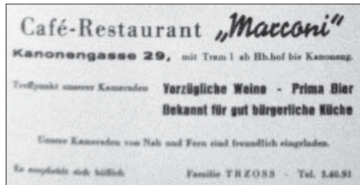
Werbeanzeige des Marconi

In: Der Kreis – Le Cercle , 8. August 1943