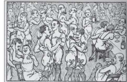
Der 1. Internationale Homosexuellen-Ball.