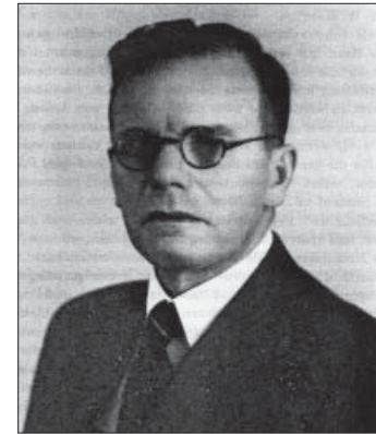
Hans W. Maier

und einen Anhang, in dem diese erläutert und bezüglich ihrer Gefährlichkeit für die innere Ordnung der Truppe klassifiziert werden. Zwei vor Sanitätsoffizieren gehaltene Referate zeigen dabei deutlich den Einfluss Maiers, der selbst den Rang eines Brigadiers in der Schweizer Milizarmee innehatte, auf die Einführung der Praxis, Homosexuelle im Sinne einer „Präventionsmaßnahme“ auszumustern. Mit der Ausmusterung sollten Konflikte mit dem Militärgesetz und eine Überbeanspruchung der Militärjustiz vermieden, Verstöße gegen die Ordnung und Moral der Truppe verhindert, aber auch Suizidprävention betrieben werden. Diese Prinzipien wurden kurz vor dem Zweiten Weltkrieg von Maier so zusammengefasst: „Die abnorme sexuelle Veranlagung wird dann einen Ausmusterungsgrund darstellen, wenn sie sich im Dienst aktiv und unliebsam bemerkbar macht. Für ausgesprochen Homosexuelle, die ihre Triebe nicht bemeistern können, ist der Dienstbetrieb eine außerordentlich gefährliche Situation, aus der man sie befreien sollte, umso rascher, wenn es sich dabei um Unteroffiziere oder Offiziere handelt.“ 35