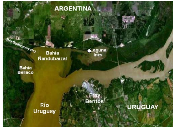
Figura 1. Sitio de muestreo en el río Uruguay.