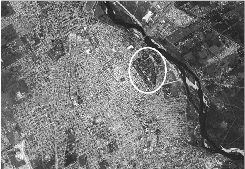
Fig. N°82 | Vista satelital actual de la ciudad de Santiago del Estero, en la que se observa el recorrido del Río Dulce en sentido noroeste-sudeste y la ubicación del Parque Aguirre

Los trabajos de prospección, sondeo y excavación realizados en el Parque durante los años 2009 y 2010 incluyeron la apertura de 37 pozos de sondeo de 0,50 x 0,50 m de lado y 1, 25 m de profundidad y 34 cuadrículas