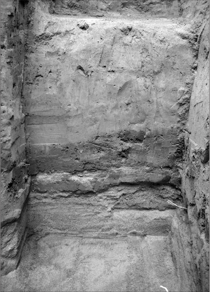
Fig. N°87 | Detalle del perfil sedimentario de una cuadrícula del sector A en el que se observa la sucesión de estratos detectada.