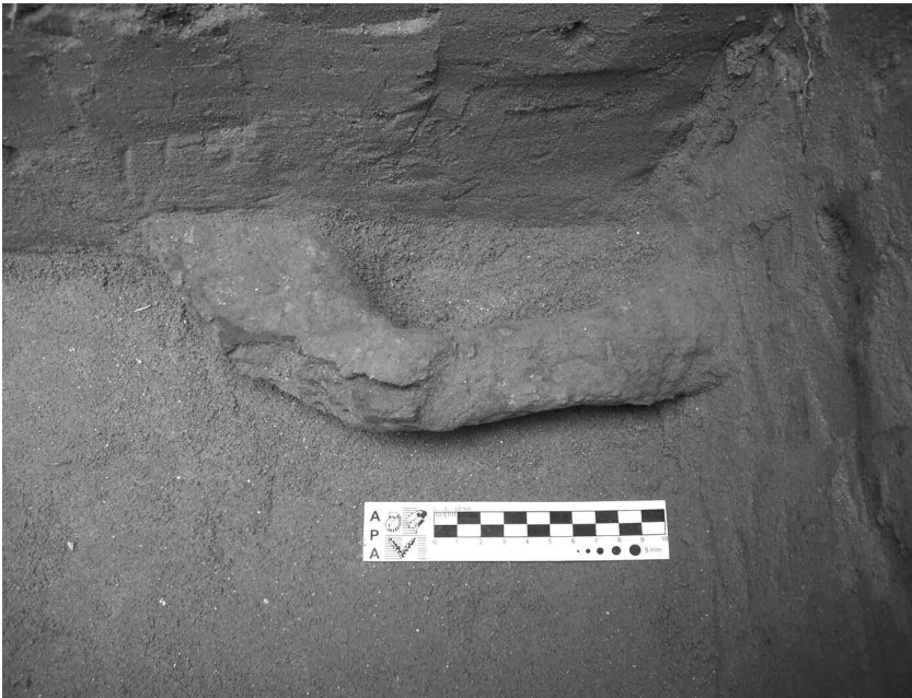
Fig. N°88 | Detalle de la herramienta de hierro hallada en el interior de una de las cubetas identificadas en la base del perfil del sector A.

En todas las unidades excavadas en el sector A la presencia de material arqueológico disminuyó progresivamente entre 1,45 m y 1,80 m de profundidad hasta desaparecer por completo a los 2 m, observándose una secuencia inversa de incremento del porcentaje de arena en el sedimento, que aproximadamente a 1,75 m adquiere las mismas características que las definidas para el del lecho del río. Microsondeos realizados por debajo del nivel máximo de excavación de las cuadrículas permitieron constatar que dicha esta continúa hasta por lo menos 3,5 m de profundidad, y datos proporcionados por constructores locales indican que de hecho se extendería cuando menos cuatro metros más (Castiglione com. pers. ).