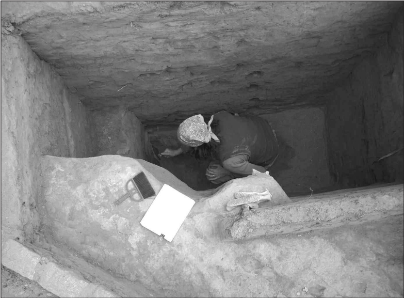
Fig. Nº86 | Detalle de una de las unidades excavadas en cuyo primer nivel se observa es estrato endurecido identificado como evidencia de una inundación ocurrida a principios del siglo XX.

Los fragmentos hallados aparecieron dispersos en el sedimento, sin un esquema de asociación aparente entre sí, y en gran parte de los casos con evidencias de fracturas previas a su depositación, lo que nos llevó a