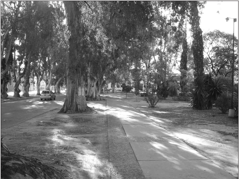
Fig. Nº84 | Vista actual del Parque Aguirre en el sector ubicado a espaldas del Templo de San Francisco Solano

El sector A, en cambio, presenta un esquema sedimentario completamente diferente. Al igual que en el B, los primeros 15 a 20 cm corresponden al suelo sobre el que se desarrolla la vegetación del parque y en la que aparecen incluidos restos de elementos modernos de descarte, tales