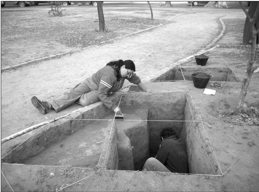
Fig. N°85 | Vista general de uno de los sectores excavados.

Asimismo, en algunas de las cuadrículas excavadas fue posible observar, a unos 40 cm de profundidad y con notable claridad, un estrato limo-arcilloso muy compacto, de un par de centímetros de potencia, que estimamos corresponde a una de las últimas grandes crecidas del río sobre la ciudad, ocurrida en los últimos años del siglo XIX. Al menos tres